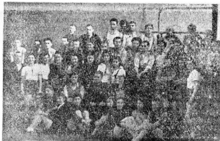
Учесници начелничког течаја у Бањој Луци

ствима чувам државно и народно јединство. И ја сам решен, да ову дужност без колебања испуним до краја. — ЧУВАТИ ЈЕДИНСТВО НАРОДНО И ЦЕЛИНУ ДРЖАВУ, то је највиши циљ моје владавине, а то мора бити и највећи закон за мене и свакога“.