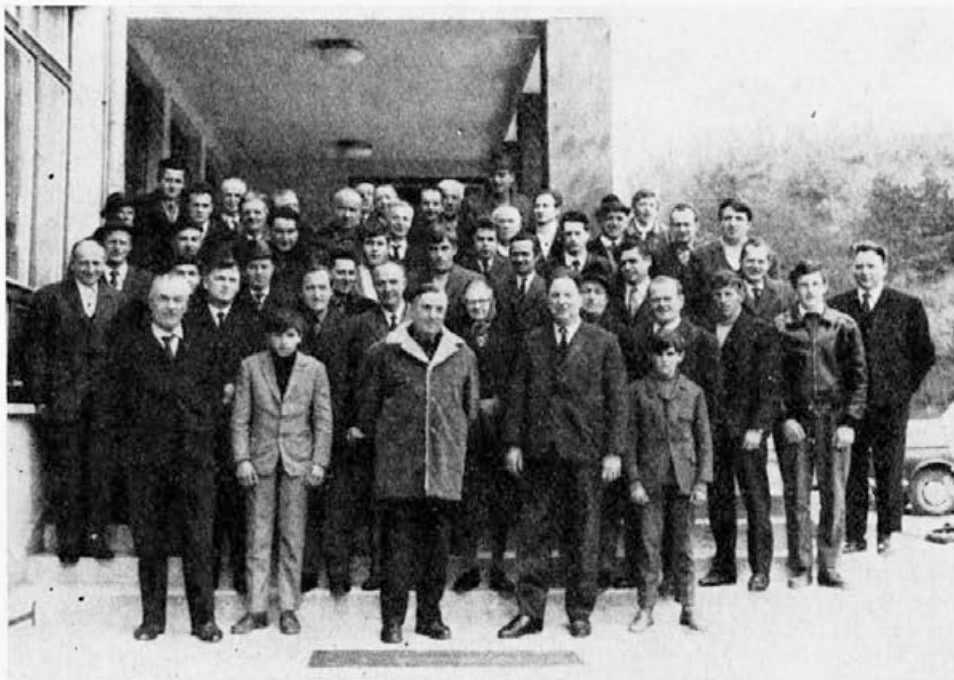
Čebelarji novoustanovljenega društva Kanal-Brda

Kdor želi postati gostitelj članov navedenega društva, naj pošlje zaradi evidence prepis prijave ZČDS, ki jo bo poslal društvu v Anglijo.