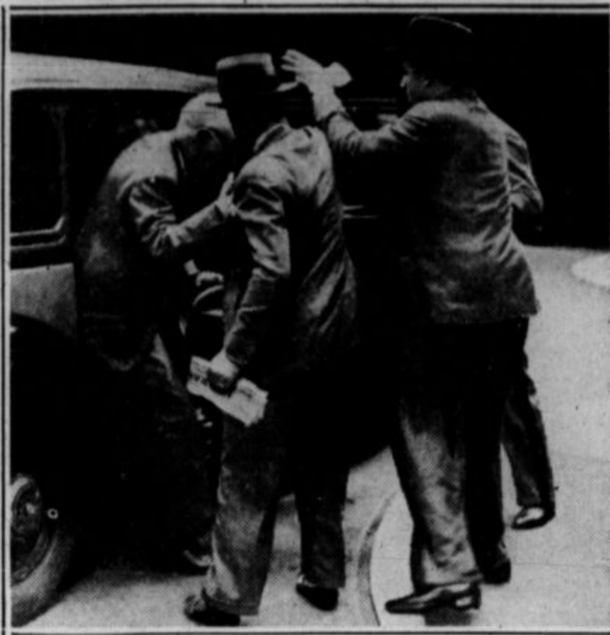
Juan March je najbogatejši španski kapitalist. On je poleg cerkvenih knezov prispeval prve milijone za financiranje fašistične kontrarevolucije v Španiji. Ko se je pričela, se je umaknil v Francijo. Na tej sliki ga njegovi privatni stražarji zakrivajo pred časnikimi fotografi.