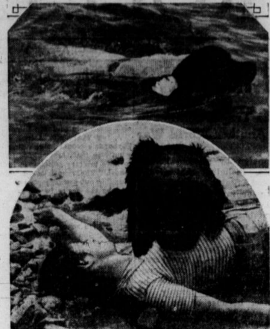
Pri jezeru Bear Valley v Kaliforniji imajo za reševanje omaganih plavalcev trenirane Newfoundlandke pse, ki so naučeni priti plavalcu ali plavalki na pomoč takoj čim opazijo, da omaguje v vodi. Na sliki je pes, ki vleče iz vode plavalco in na obrežju ko jo straži, dokler ne pride človeška pomoč.