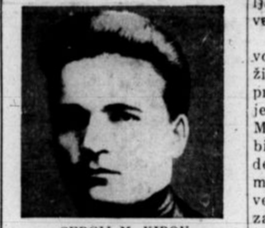
SERGIJ M. KIROV

Ko so zarotniki izvršili posrečen atentat na Kirova, je sovjetska vlada odgovorila z eksekucijami, s sistematično propagando proti kontrarevolucionarjem in z dramatično