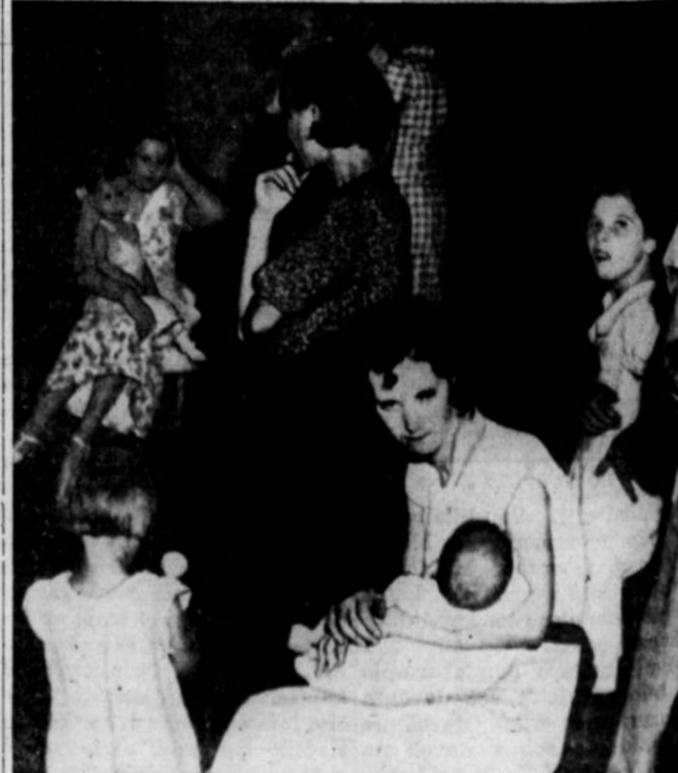
Zene in otroci starih premogarjev, ki so bili zajeti v majni pri Moberlyju, Mo. Samo dva so prinesli živa iz jame. Podatki o tej nesreči so pod vrhno sliko na tej strani.