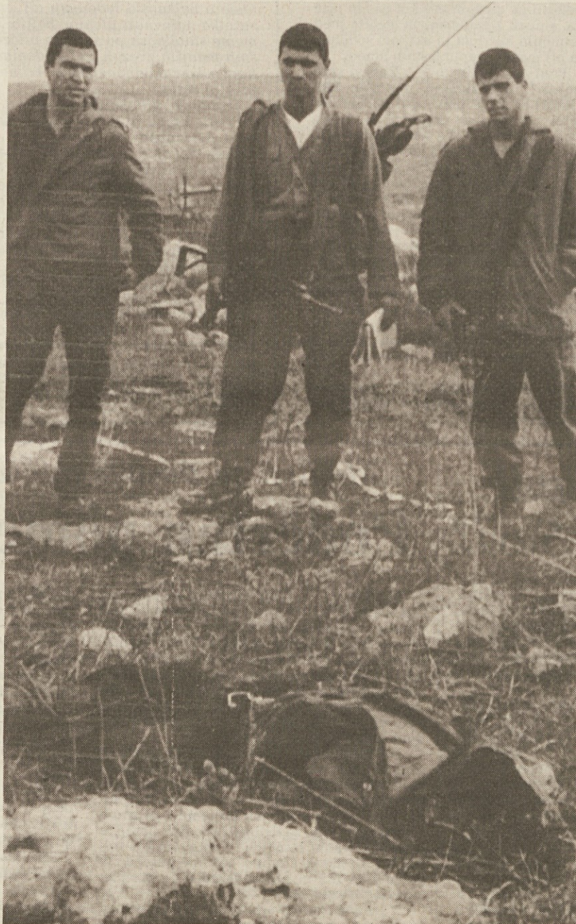
Izraelski vojaki ob trupu padlega palestinskega gverilca