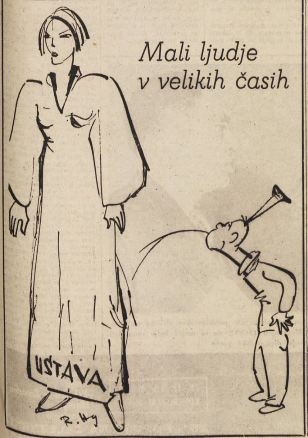
Mali ljudje v velikih časih