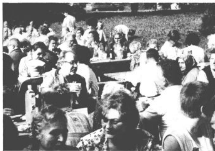
Presenečenj ni manjkalo, prijetnega razpoloženja pa prav tako ne