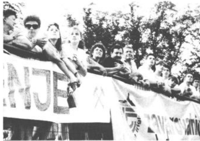
So se gledalci ustarišili vročine?