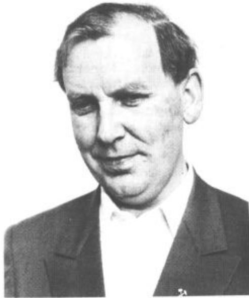
"Z veseljem čestitam rudarjem, njihovim družinskim članom in vsem, ki so prijatelji"