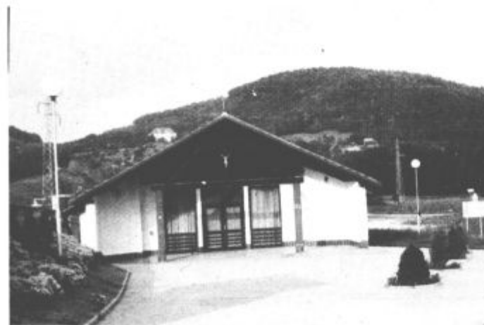
Luči v obliki "bučk" so razveselile mnoge Šentiljčane, saj bodo večeri sedaj v kraju prijaznejši, kar bo še posebej občutno pozimi

Če ne bi bilo zagnanih in pridnih krajanov, bi bila vrednost investicije bistveno višja, tako pa je celotna veljala 1 milijon in pol SIT (in ne 40 tisoč DEM, kot so namigovali nekateri v kraju). Žal investicija še ni v celoti plačana, saj je bilo sredstev, ki so jih kra-