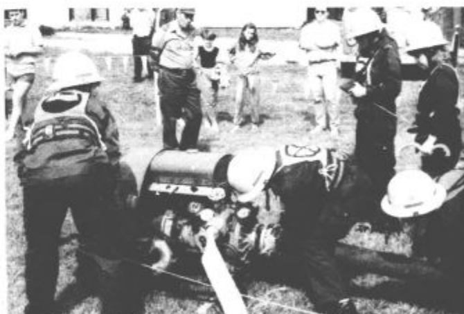
Prehodni pokal - simbolična rudarska svetilka - med ženskami v Hajdoš

razglasitev rezultatov so so z nastopom popestrili tudi člani Rudarskega okteta iz Velenja.