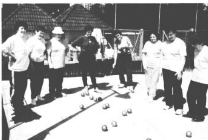
Za pokal so se tokrat prvič pomerile tudi balnarke

Na strelišču Mroža se je šest ekip pomerilo v streljanju z zračno puško. Vrstni red: 1. Velenje Desni breg 680 krogov, 2. Šmartno ob Paki A 631, 3. Velenje Levi breg 593, 4. Šoštanj 575, 5. Šmartno ob Paki B 497, 6. Pesje 473. V posamični konkurenci so prva tri