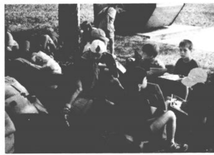
Veselite se razglasitvi rezultatov v Mengšu