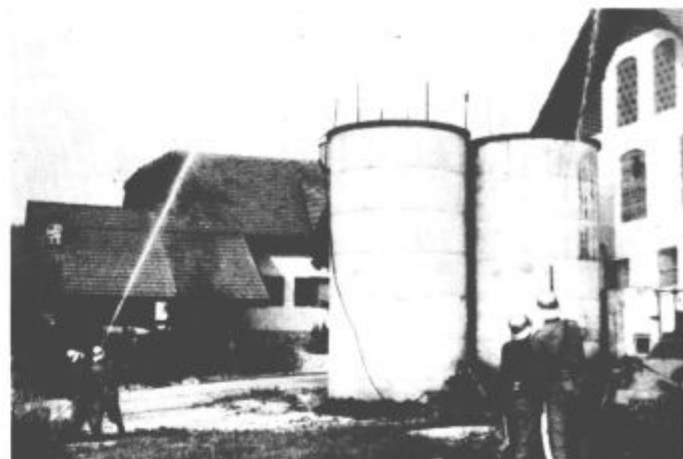
Vaja v Kokarjah je bila zares mokra

Še nekaj zanimivih točk je bilo na dnevnem redu. Med drugim problematika Delavske godbe na pihala občine Mozirje ter problematika RTC Golte (o tem več prihodnjič), posebna problematika pa je (ne)vračanje kreditov za nova delovna mesta, kjer so se člani izvršnega sveta zavzeli za dosledno izterjavo.