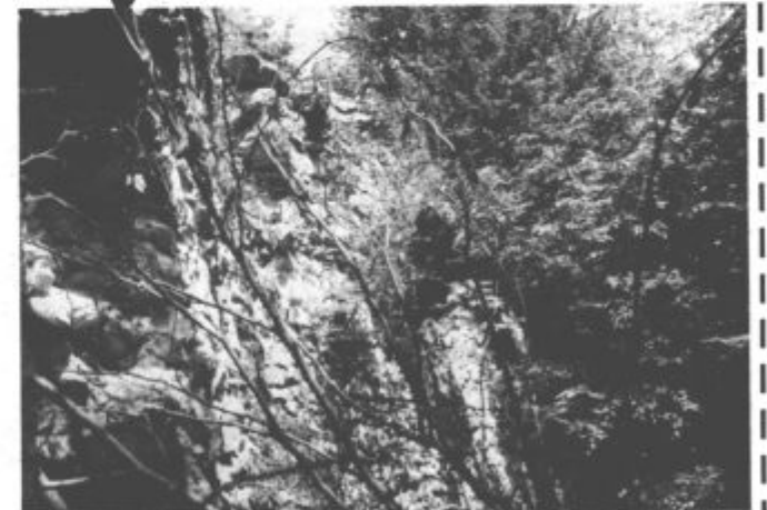
Nevarno je tudi grajsko obzidje, pravijo domačini

jala nevarnost novih zruškov in odlomov, krajani pa so morali za pot v Velenje uporabljati dolg obvoz, saj so se vozili na Lepo Njivo, so v občini Velenje začeli z aktivnostmi