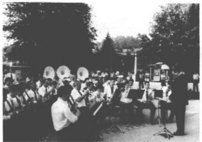
V Velenju se je tudi letos zbralo malo ljudi na predvečer pred dnevom državnosti ob lili neodvisnosti oziroma ob drevesu sožitja, kot so jo poimenovali pred tremi leti. Se nam neodvisnot še vedno ni dovolj vtisnila v srce? (vos)

Državo pa smo ustvarili zato, da v njej ne bi bilo sovraštva, žalitev, ponižanj, zlorab in socialnih krivic, zato, da ne bi bil nihče odrinjen od skupnega iskanja odgovorov o našem sedanjem in prihodnjem življenju."