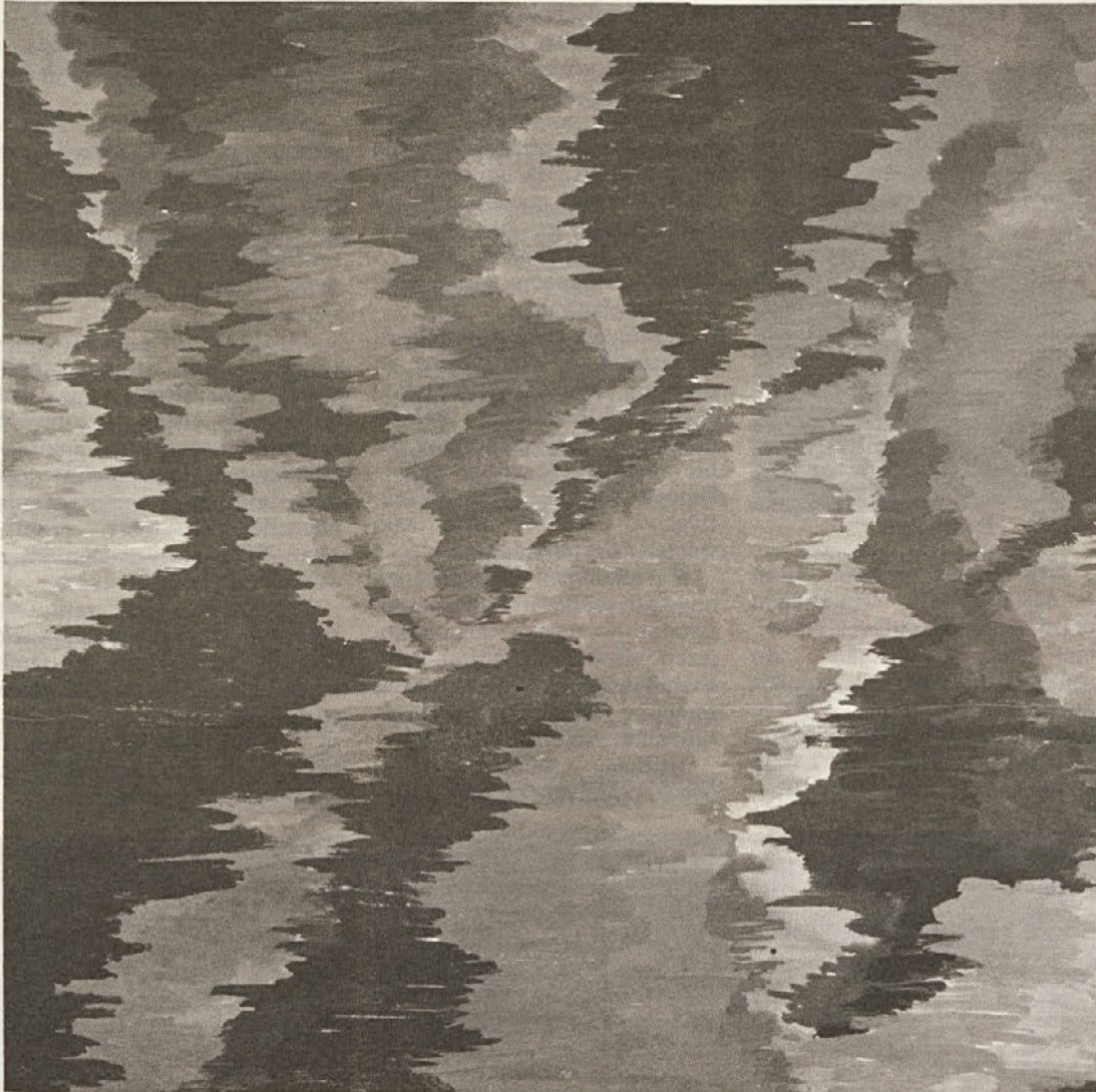
BRIGITA MLAKAR, 8. b Slikanje ob glasbi

učinkovito uresničevanje družbene samozaščite mogoče doseči le ob ustrezni stopnji družbene zavesti, varnostne kulture, solidarnosti med ljudmi, družbene in samoupravne organiziranosti in usposobljenosti. Vse to pa lahko dosežemo le s stalnim političnim delovanjem zveze komunistov in sindikata. Uresničevanje aktivnosti in nalog na področju družbene samozaščite zahteva ustrezno usposobljenost vseh delovnih ljudi v temeljni organizaciji. Pri usposobljenosti moramo težiti k temu, da organiziramo dovolj izobraževalnih oblik in da z njimi prodremo do slehernega delavca temeljni organizaciji. Takšna usposobljenost mora temeljiti na ustreznih progra-