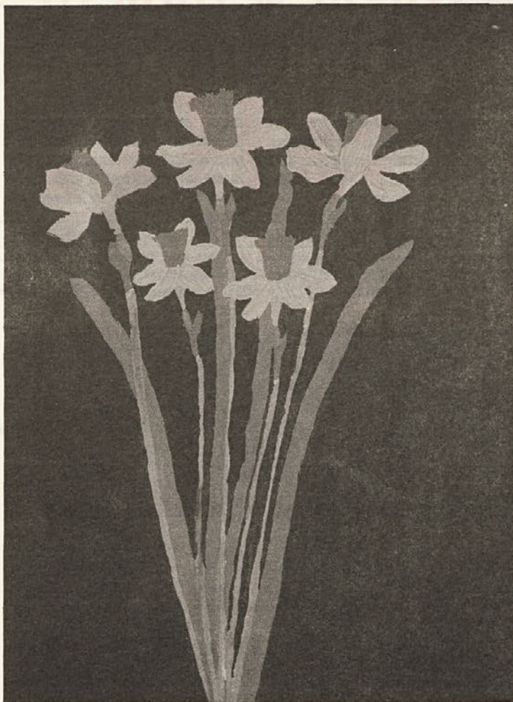
HROVAT IRENA, 7. b – Narcise