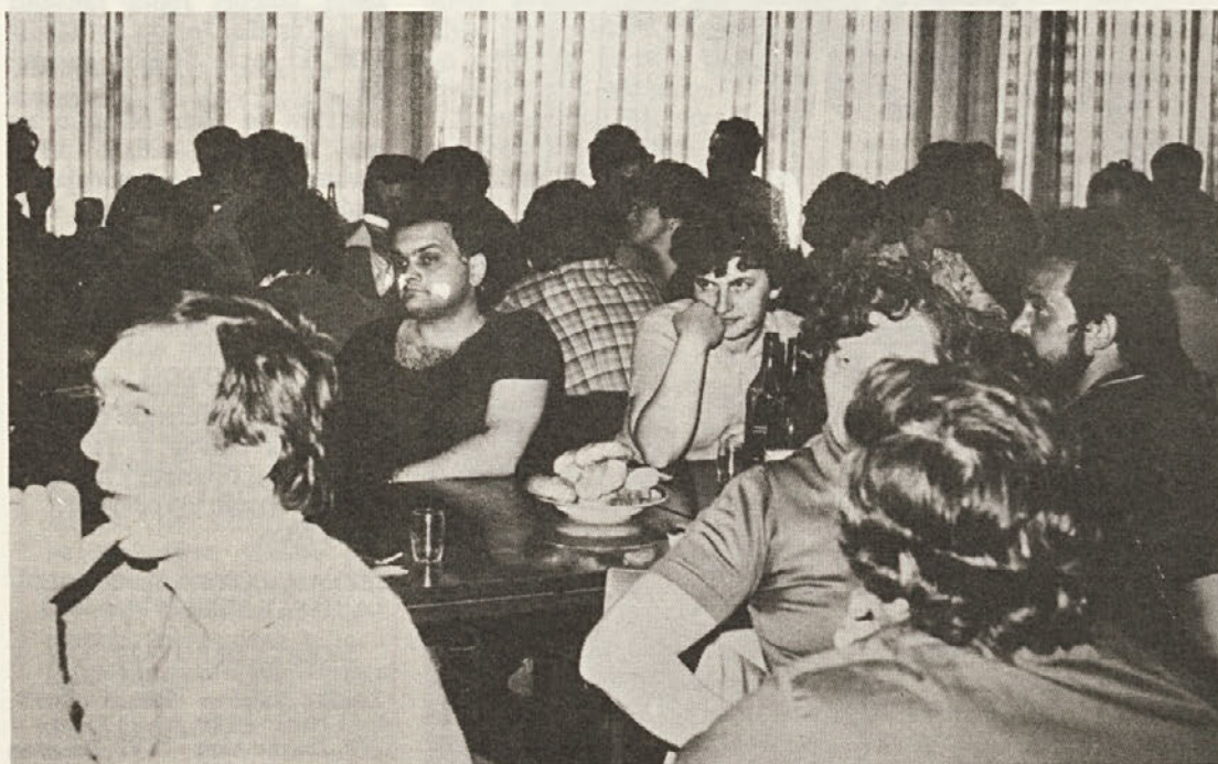
Del udeležencev srečanja