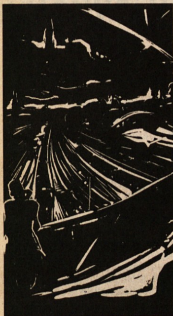
BOŽIDAR JAKAC: Domotožje po Novem mestu, linorez

Le kdaj bomo sneli te trde okove, le kdaj bomo smeli na rodne domove?