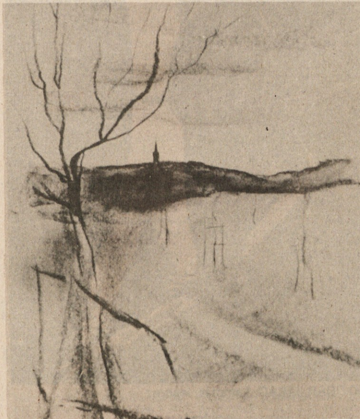
BOŽIDAR JAKAC: Pada mrak, črna kreda

IV. Toliko smrti že nosim v sebi: kot nož se mi obračajo v duši. Vsakdo, ki je odšel, si hoče odrezati kos. A jaz ga ne dam. Borim se za vsak kos posebej, ker, kaj vem, morda je tako: ko popustiš in vsaki teh smrti odstopiš en kos, počasi še sam dozoriš. A kljub obližem, ali pa zaradi njih, postajaš kot stara, odslužena vaza.