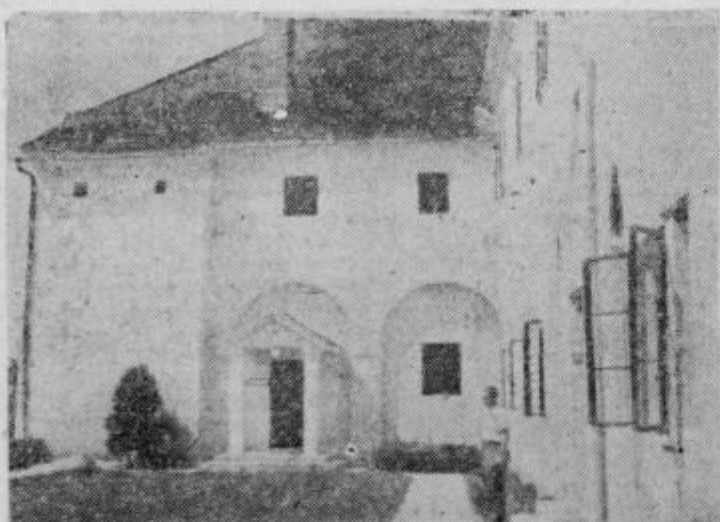
Vhod v študijsko knjižnico in Mestni arhiv