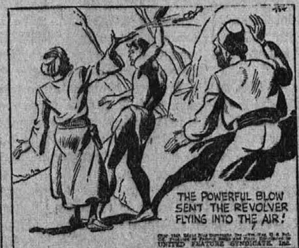
THE POWERFUL BLOW SENT THE REVOLVER FLYING INTO THE AIR!