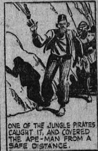
ONE OF THE JUNGLE PIRATES CAUGHT IT, AND COVERED THE APE-MAN FROM A SAFE DISTANCE.