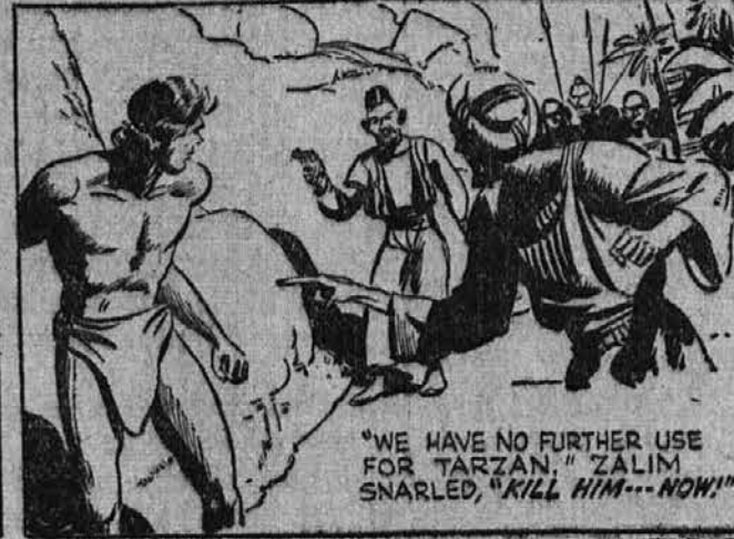
"WE HAVE NO FURTHER USE FOR 'TARZAN.' ZALIM SNARLED, 'KILL HIM--NOW!"

Ko je bil samokres obrnjen proti njemu, je imel Tarzan samo še toliko časa, da je dvignil Zalimovo roko v zrak.