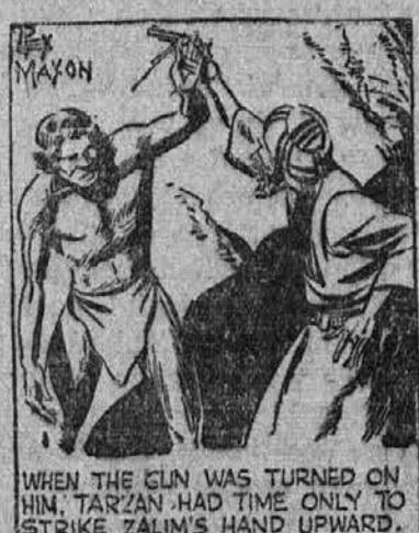
WHEN THE GUN WAS TURNED ON HIM, TARZAN HAD TIME ONLY TO STRIKE ZALIM'S HAND UPWARD.

OBSODBA (154) (Metropolitan Newspaper Service) Napisal: Edgar Rice Burroughs