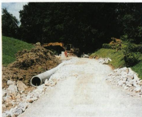
Rekonstrukcija Mačkove ceste.

Na podlagi 10. člen Pravilnika o štipendiranju (Uradni vestnik Občine Lukovica, št. 5/99) Občina Lukovica objavlja