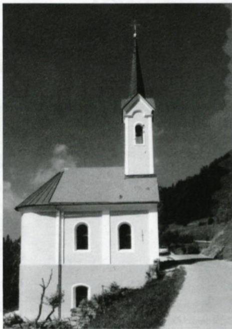
Kapelica Lurške Marije

V prvi številki glasila občine Lukovica, čigar član uredništva sem, bi rad izrekel tole: Življenje teče dalje! Lepo je živeti, če si zdrav, pošten in delaven.