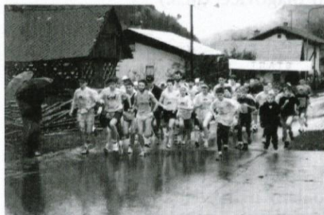
Tek za krof

blikovati izjemno dober in pester program dela, ki bi bil lahko zelo dobra podlaga za delo vsem manjšim vasesm ali krajem, ki si šele utirajo pot v organizirani športno-rekreativni prostor. Poudariti pa je potrebno, da smo vsa ta leta vlagali velike napore v zagotavljanje lastnih virov finančnih in materialnih sredstev, v ogromno število ur prostovoljnega ljubiteljskega dela in vedno iskali sodelavce v vseh tistih segmentih, ki so bili nujni in najpomembnejši.