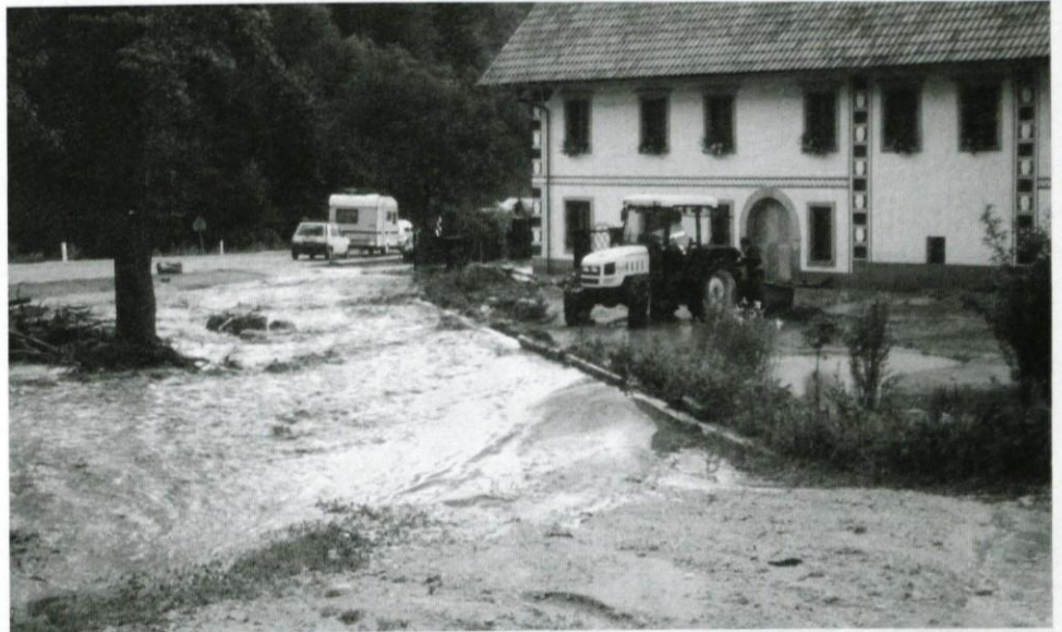
Tako je bilo pri Smrkolju...