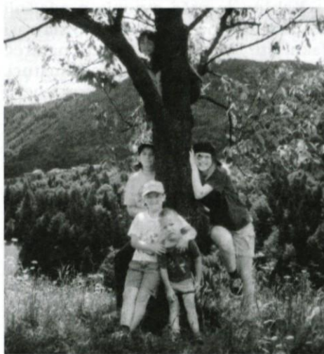
Takih prostorov je malo...

V zadnjih letih se je, kot ena izmed redkih izjem v naši občini, število otrok v Šentožboltu in Učaku precej povečalo, k čemur so pripomogle nekatere mlade družine. Poleg tega so se izboljšali odnosi med vaščani, kar je spodbudilo tudi mlade, da so se začeli več družiti med seboj. Ob tem pa je postal vse bolj očiten problem, ki je pravzaprav že star in spremlja kar nekaj generacij - to je, da v Šentožboltu ni niti enega urejenega in zavarovanega prostora, kjer bi se otroci in mladi lahko srečevali.