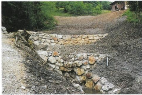
Sanacija plazu Markovšek.

- Odbor za gospodarstvo, obrt, kmetijstvo in turizem (obravnaval je vse vloge prosilcev za pridobitev posojil iz naslova kmetijstva ter obrti, podjetništva in turizma in predlagal višino odobrenih sredstev posameznim prosilcem. V postopku je zdaj že ponovni razpis za obe vrsti posojil, ki velja do porabe vseh razpisanih sredstev). Se vedno imate torej čas, da oddate svojo vlogo, pogoji razpisov so bili objavljeni v 5. številki nekdanjega skupnega glasila Slamnik!