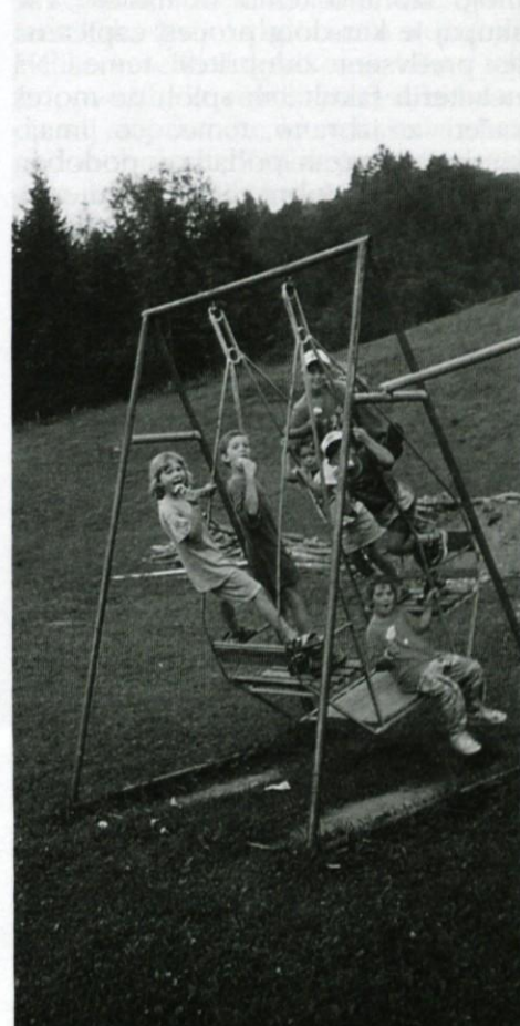
...in takih še manj

Komisija za preventivo in varnost v cestnem prometu Občine Lukovica