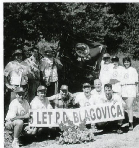
Tako je bilo lani

Planinsko društvo Blagovica Bojan Pustotnik