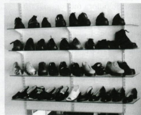
Rezultat dela očeta in sina

»Oba moja otroka rada hodita v hribe, pa sva tako na stara leta začela