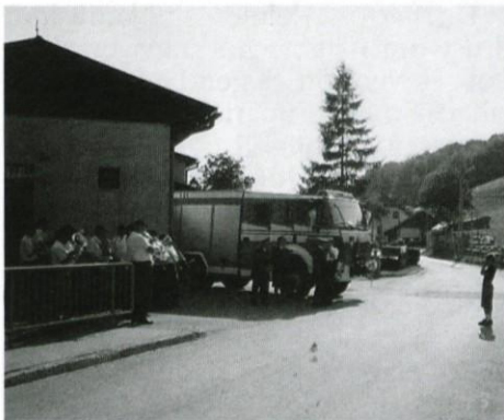
Pripravljen za pomoč

Naj se na koncu zahvalim vsem, ki so kakorkoli pomagali pri nakupu našega tovornjaka, še posebej Občini Lukovica, trgovsko podjetje Naprede in Gostinsko podjetje Trojane.