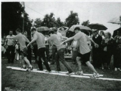
Mladi v akciji