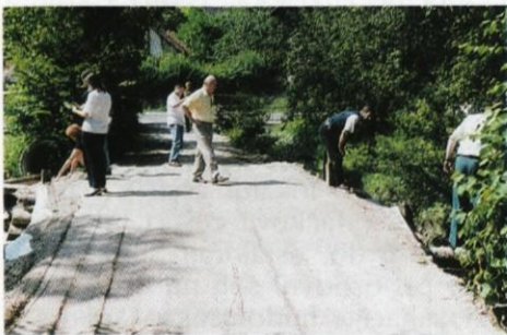
Komisija za ocenjevanje škode po neurju.