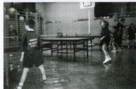
Bela žogica osvaja

- Ostale stalne in občasne naloge oz. aktivnosti, kamor sodijo sodelovanja s krovnimi zvezami, občino Lukovica, OS Krašnja in matično OŠ Janko Kersnik Brdo, s KS Krašnja in njenimi ostalimi društvi (predvsem z KUD Fran Maselj-Podlimbarski in PGD), z velikim številom sponzorjev in donatorjev ipd. Društvo že peto leto vsak mesec izdaja Društveni informator in članstvo povezuje tudi s stalmimi uradnimi urami društvene pisarne. ŠD Krašnja pa daje velik pomen tudi sodelovanju s sredstvi javnega informiranja, predvsem iz športnega področja in v skladu z možnostmi tudi nakupom nekatere športne opreme in rekvizitov. Veselo pa je tudi slehernih sodelovanj z drugimi sorodnimi društvi v Sloveniji in izven nje.