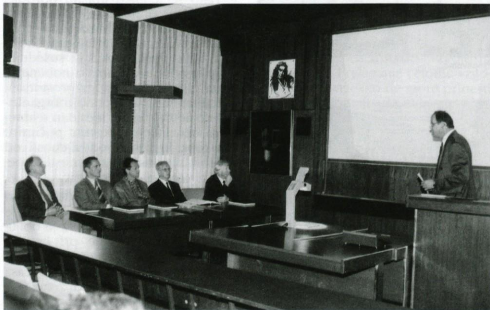
Zagovor doktorske dizertacije

Kam uvrščajo tuji strokovnjaki naše znanje na tem področju?