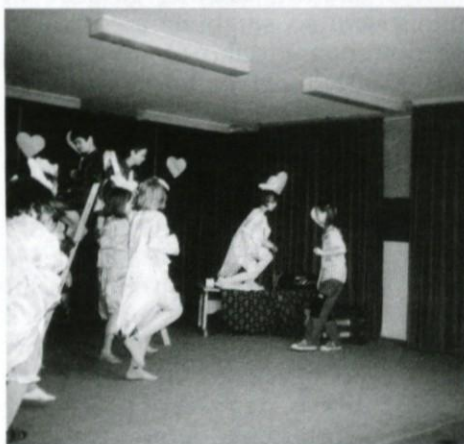
Prizadevni pa so, kajne...