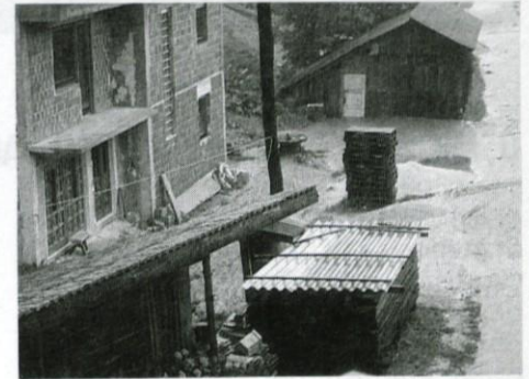
...in tako na cesti