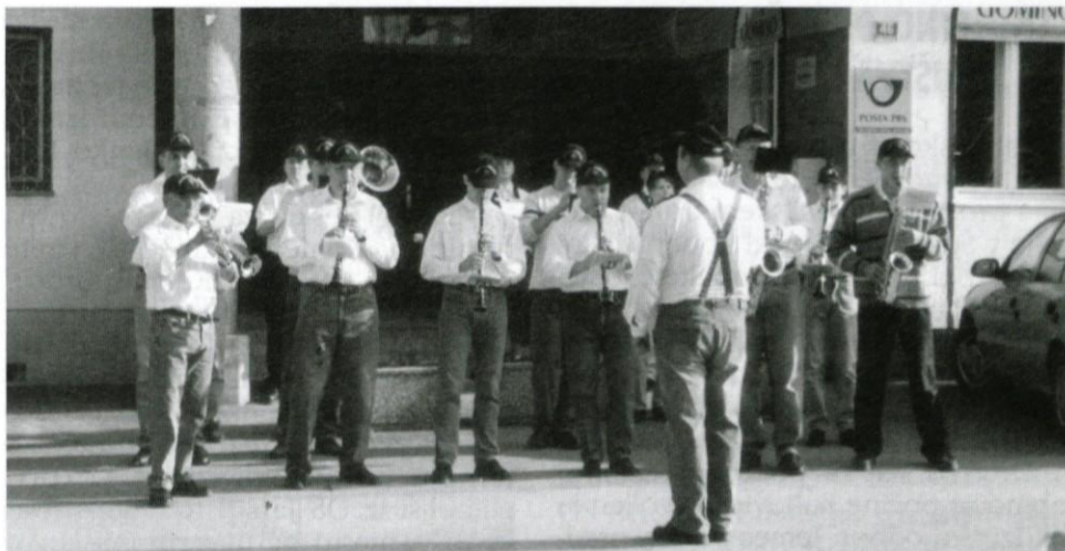
Prvi nastopi so že za nami

Nalog in načrtov ima Lukovška godba res veliko. Ena najpomembnejših je, da pridobimo čim več članov. Trenutno nas je 15, zato nam ob nastopih pridejo pomagat fantje iz sosednjih godb, saj sami ne pokrijemo vseh instrumentov, ki so potrebni za normalno delovanje godbe.