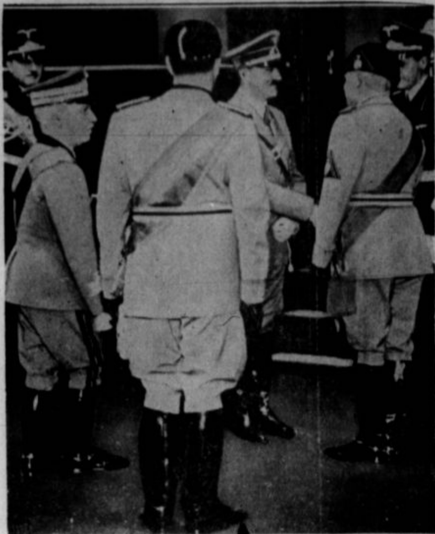
Mala "periona" na levi gornje slike je italijanski kralj Viktor Emanuel. Mussolini mu je ob zadnjem Hitlerjevem obisku dovolil, da naj bo nemški firer kraljev gost. Vleču temu je bil Emanuel čisto navadna figura, kot jasno izpričuje gornja slika.