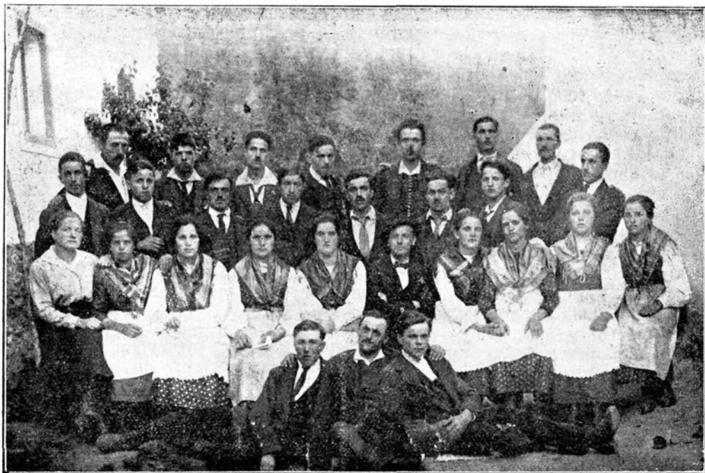
Prosvetno društvo na Planini pri Cerknem.

Kako more govornik živo opisati moč resnice, lepoto ÷ednosti, grozoto nizkotne pregrehe in poslušalce navdušiti za svoje ideje, če ne zna misli izraziti s sijajnimi slikami in duhovitimi primerami? Vse to pa zajema iz domišljije. Isto je pri pisatelju, ki rabi mesto govora, pero. V dobrem ÷tivu najde lahko vsakdo hrano za zdravo domišljijo. V njem najde tudi bogato zalogo besedi, pisano izbero izrazov, lep slog. Brez vsega tega pismu, poroçilu nekaj manjka, govori so nezanimivi. Če vse knjige niso za vsakega ÷loveka, ni šund pa za nobenega. Pod šundom si misli Finžgar knjige, ki razpaljajo nizke nagone, pogubne strasti, razburkavajo in trujejo zdravo domišljijo. »Slabo ÷tivo je nevarnejše, kot hudoben prijatelj,« — pravi nekdo; — »s hudobnim prijateljem obçuje ÷lovek le tu pa tam,