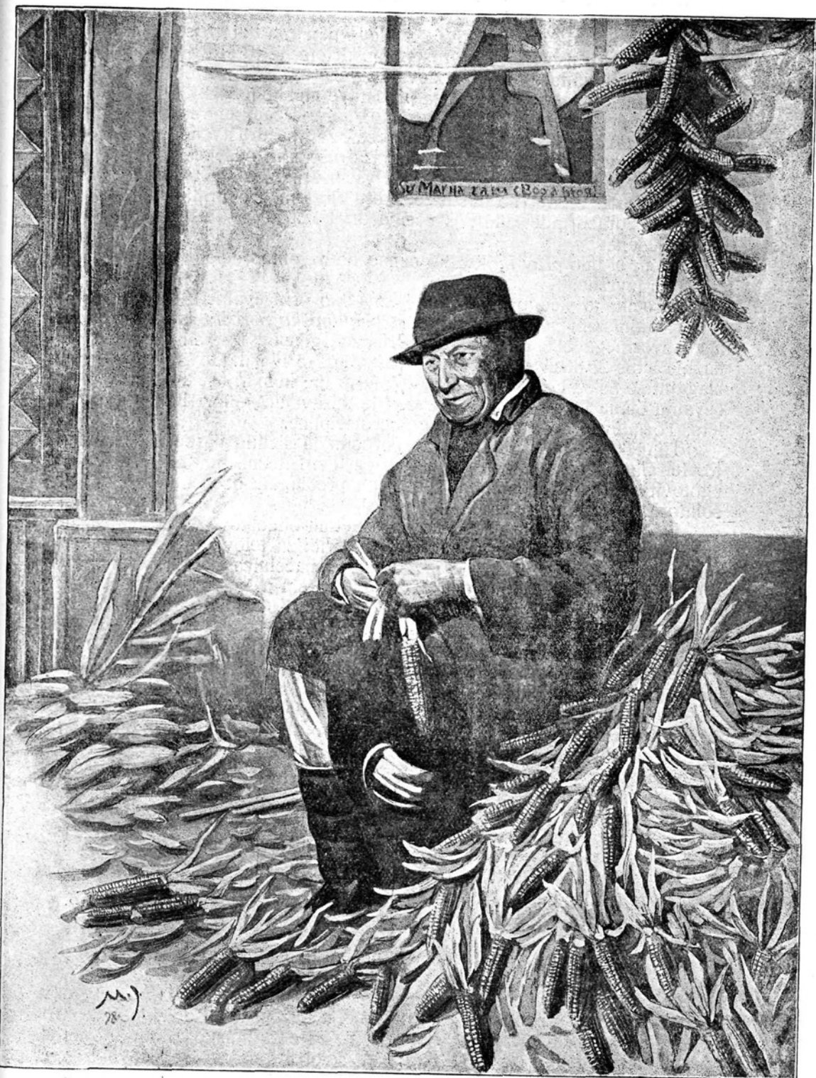
Jesensko delo na kmetih.