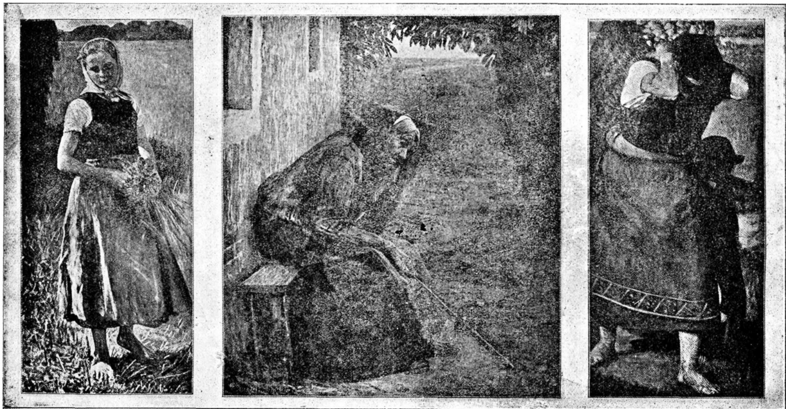
Tri dobe življenja.