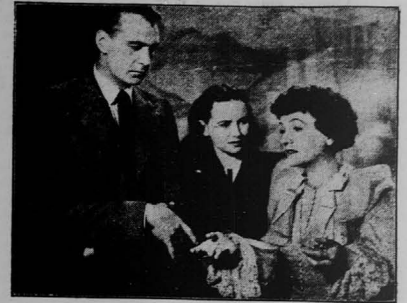
Prizor iz saloigre "Casanova Brown", v kateri nastopajo Gary Cooper, Teresa Wright, Frank Morgan in zbor zvezdnikov, sedaj v Radio City Music Hall, 6th Avenue in 50th St. v New Yorku, in poleg tega gala predstava na odru.

sedanja svetovna vojna v prid svobode in demokracije.