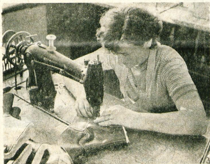
Mladinka pri delu v Peko

manjkanja predavateljskega kadra, prepotrebnih prostorov in finančnih sredstev. Menimo, da bi delo na ideološkem področju bilo v bodoče bolj uspešno, če bi imeli razna avdivizuelna sredstva, kot so kinoprojektor, episkop in diaporojektor, ker bi s tem vzbudili večji interes mladine in bi sama predavanja postala bolj pestra in zanimiva.