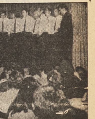
Prejšnji teden so imeli Sovodenjci v gosteh v svojem Kulturnem domu pevski zbor iz Mirna, ki je s svojim celovečernim nastopom zaključil letošnjo sezono. Ob tej priložnosti je nastopil tudi domači monet. O priveditvi, ki je uspeša, pa čeprav je bila tretja v enem tednu, smo pisali prejšnji dan. Danes objavljamo še sliko mirenških pevcev

Nocoj imajo na sporedu tudi tekmovalje v briskoli. Zmagovalci bodo dobili dva prstata, drugi par se bo moral zadovoljiti z enim prstatom, tretja dvojica bo dobila petlenko vina, četrta pa dve salami. Jutri zvečer bodo ob 20. uri nastopili domači folkloristi. Napovedanega nastopa openških kotalkarjev ne bo, ker ima komaj urejena cementna ploščad nekater napake, ki jih bo treba, brž ko bo praznik mimo, popraviti.