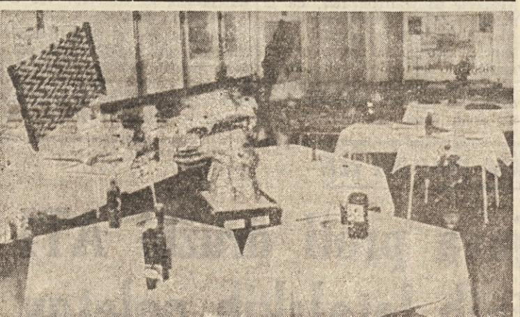
Solske razstave se vrstijo. Na gornji sliki razstava na osnovni šoli v Dolini

Res je, švedska bo še naprej ostala parlamentarna monarhija in to vsaj dokler bo živ njen zelo priljubljen danes že 90 let star kralj Gustav VI. Za dobo svojega časa, v kateri bo njih politična in družbena ureditev «lažje dihala».