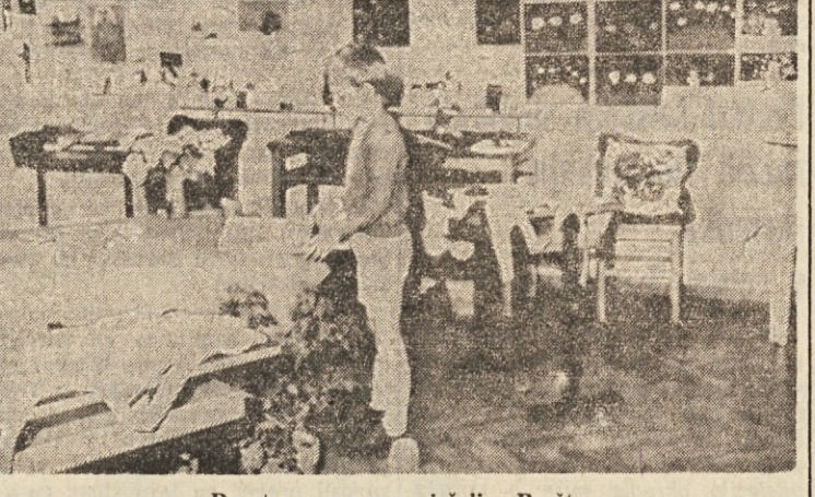
Razstava na osnovni šoli v Borštu