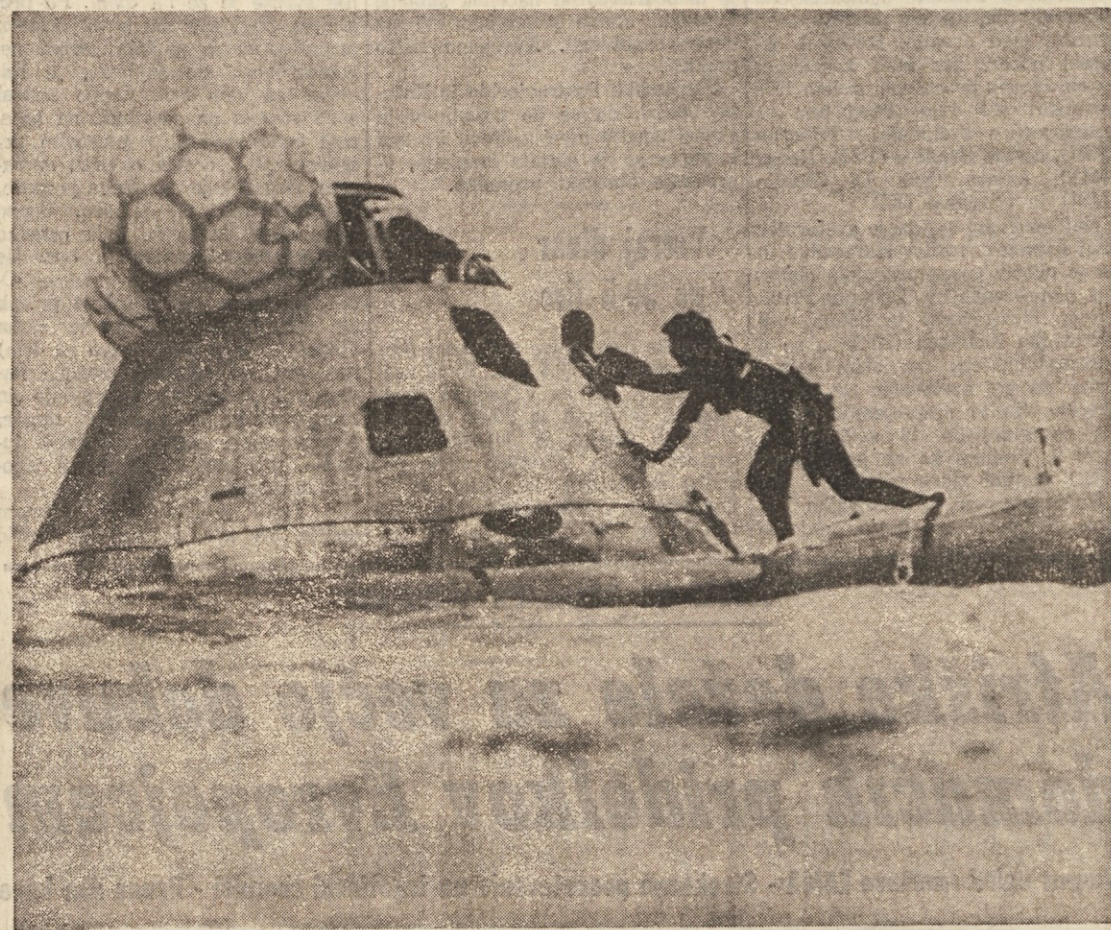
Včeraj popoldne ob 15.49 (po italijanskem času) so ameriški kozmonavti Conrad, Kerwin in Weitz srečno prileteli na Them oceanu po 23 dneh bivanja v vesolju. Na sliki: potapljač obdaja vesoljsko ladjico z varnostnim pasom. Poročilo berite na 8. strani