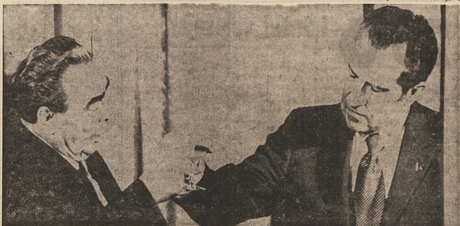
Brežnjevi in Nixon si nazdravljata po podpisu sporazuma za pospešitev pogajanj o omejevanju jedrskega oboroževanja