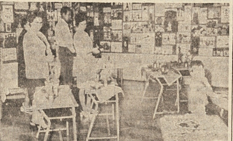
Razstava na osnovni šoli v Boljuncu