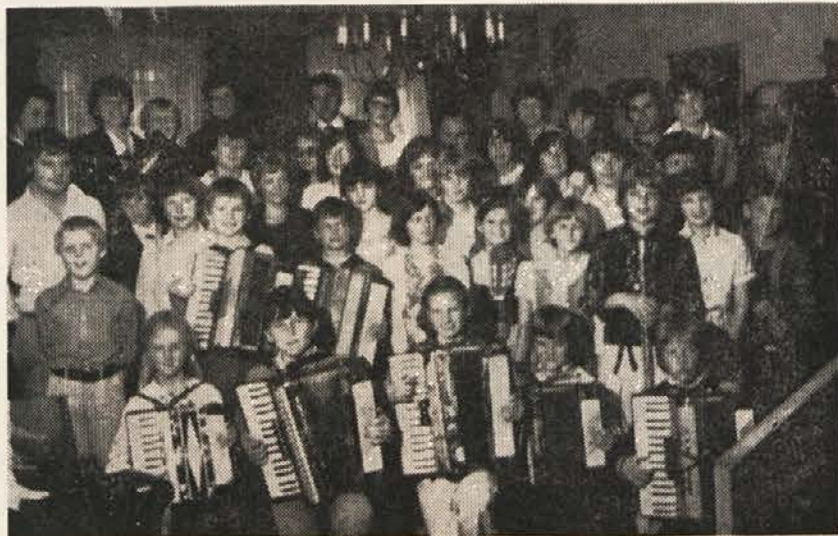
Prva skupina učencev „glasbene šole“ v Pliberku s svojimi učitelji