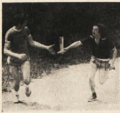
Predaja štafetne palice

Vsaka zdrava dejavnost, ki se odvija v okviru manjšin, je narodno-obrambnega značaja. Tako je tudi s slovenskim športom na Koroškem. Z izvedbo štafete smo ho-