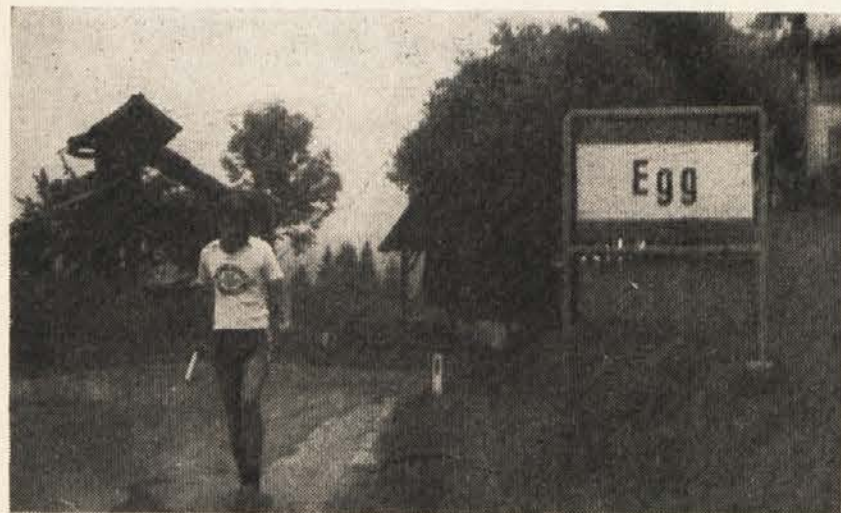
Tekoč štafete teče skozi Brdo pri Šmohorju v Ziljski dolini

Pred prihodom štafete so naši najmlajši in mladina imeli razna tekmovalja in sicer v veselem deseteroboju, v polževski kolesarski dirki, nihalni štafeti, tekmovalju s konjički, streljanju enajstmetrovk in metanju žoge v koš, vmes pa je igrala odlična pihalna godba DPD „Svoboda“ iz Postojne. Ta nadvse privlačni in zabavni program so pripravili profesorji slovenske gim-