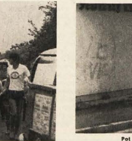
Pot je vodila štafeto tudi skozi Bistrico v Rožu

teli prikazati, da Slovenci ne živimo samo tam, kjer je Avstrija blagovolila dati nekaj dvojezičnih krajevnih napisov, marveč tudi tam, kjer je potekala štafeta. Glavna proga je namreč vodila z Brda pri Šmohorju v Ziljski dolini do Blata pri Pliberku, kateri so se pridružile še stranske proge. V Bistrici v Rožu se je priključila štafeta s Kostanj in Gur. V Kožentavri je glavno štafeto