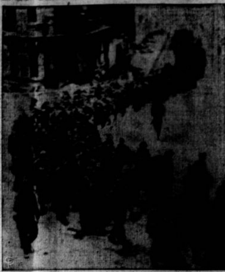
THIS LONG LINE of German soldiers surrendered with their commander, Col. Gerhardt Wilok in the final mopping up of Aachen by the Yanks. The group is being marched through the fallen city bound for a prisoner of war camp.

hano skledo, bi drugim dal vsaj skodelico!"