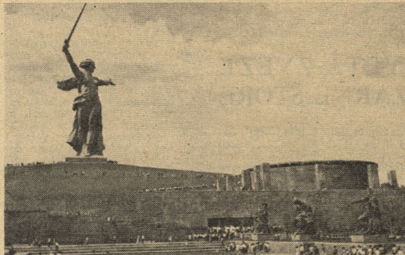
Mamaev Kurgan: Spomenik herojem stalingrajske bitke. Spredaj grobnica herojev

Kosilo smo imeli v tovarniški menzi (12 podobnih menz v tem sklopu) z odlično hrano. Po kosilu je sledila vožnja s posebno ladjo po Volgi do kanala Volga — Don (60 km).