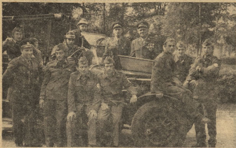
Spominski posnetek v Kapfenbergu ob gasilskem vozilu iz leta 1909