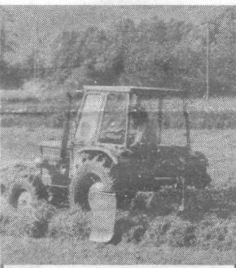
Pa vendarle, poletje se bo le pričelo.

Pri predvidenih naložbah prihaja do časovnih zamikov, kar zlasti velja za načrtovano gradnjo v zasebnem sektorju drobnega gospodarstva.