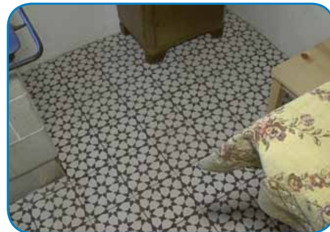
Nauve (indašnje) ploščice v künji Porabske domačije - pred obnavljanjom je je tam pet-šest fele bilau

Porabska domačija má eške edno malo sobo, v šteroj je dalo društvo pod vöminiti. »Trnok prko je že bilau, lekar že stau lejt star pod bejo. Vse smo gorapobrali, zemlau znauva vöskopali, vözvözili, vse zbetonérali pa na nauwo podivali,« mi je pokazo novinarski kolejgar ino raztomačo, ka je té pod z vrnau takšoga mardjaboriča kak va-