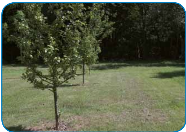
En tau andovskoga dvoriška, gde bi se leko v nauwom kempingi šatorge postavljali

Tam pri grajki mi je včasik na pamet prišlo, kak leko eden prausen turist cuj k Maloma Triglavi stauči, če je vse zagrajeno. »Dvera do cejli den oprejta, mamo ednoga od ausme do štrte vöre, steri de vsikdar tū. Če pa nej, se ga leko po telefoni pozové, gđakoli leko pride, v soboto ali nedelo tū. Mi neštjemo zaprejti biti, cil je tau, ka kak največ lüstva aj pride. Aj si poglednejo Mali Triglav, Porabsko srcé pa