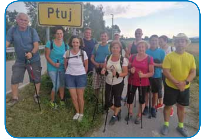
Prvi den smo prišli do Ptujja

ni Slovenci, steri se trüdiyo ostati za Slovence. Z drüge strani je tau edna lejpa paut za düšo, gde pozabiš vse brige, nika drügo nega, samo ti, paut pa cilj. Dostakrat se pravi, ka važna je paut, nej samo