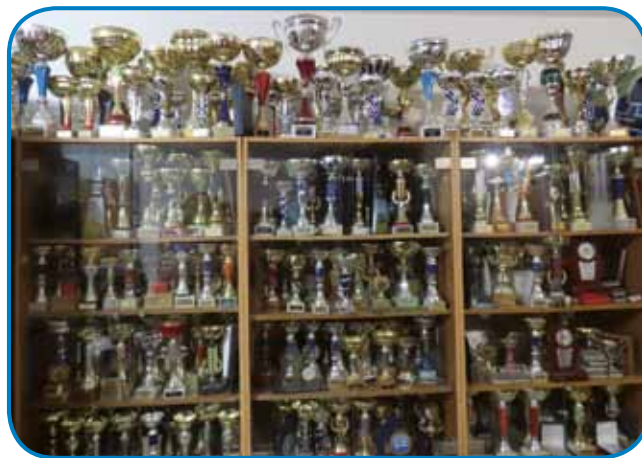
Tau so pokali, stere je daubo kak radioamater

tau pa je radioamaterstvo. O tom sva se dosta pogučavala, ali začnimo lepau po redi.