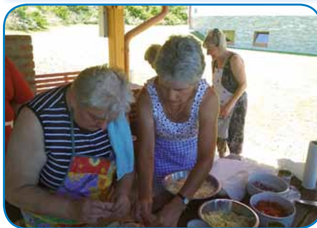
Vsefale dobraute, depa samo z merov gor dejvati