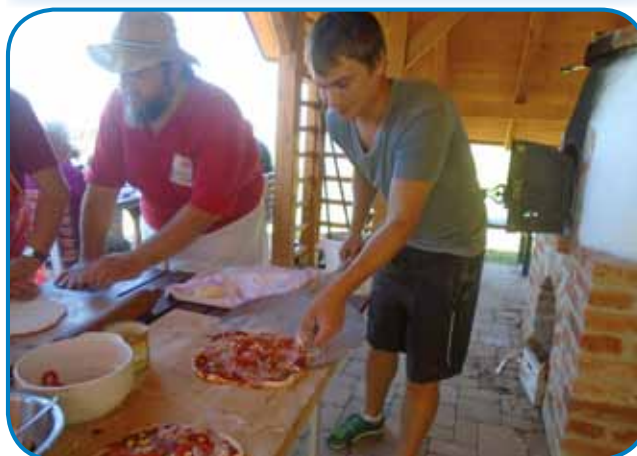
Mladi direktor Razvojne agencije je nam kūro peč pa peko pice