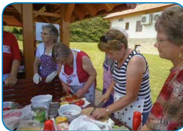
Nisterne so flajсно obračale naužice za zelenjavo pa ribaš za sir