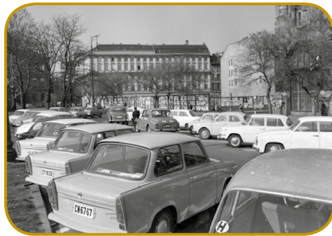
Trabant v centri madžarskoga glavnoga varaša - v vzhodnonemškem varaši Zwickau so je začnili rediti leta 1957

Drügo veuko pomauč pri gazdüvanji so dala umetna