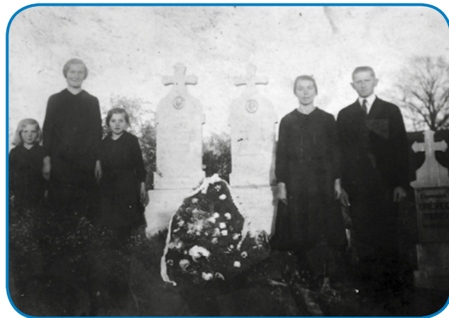
Najstarejši kejp, na pravo od križa stadjita njena stariša

Tauma se fejest veselim, ka sem zdaj bar nej sama.«