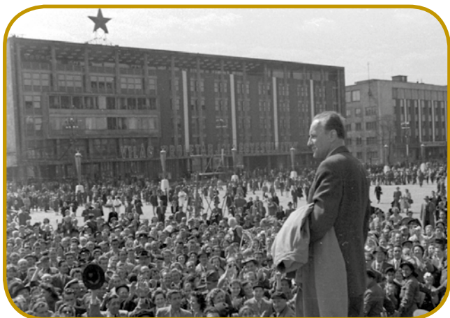
János Kádár 1. maja 1962 v Budimpešti (Felvonulás tér) - »bojeviti svevek delovnoga lüstva, štero se trüdi za lepši svej«

Po tistom, gda so Sovjeti leta 1956 dojbili vogrsko revolucijo, se je predsednik ministrskega tanača János Kádár - zvün štrafanja revolucionarov - trüdo za pridobitev pasivne večine v rosagi. Znau je, ka trbej lidam dati, ka nücajo, tak leko pride do družbenoga méra.