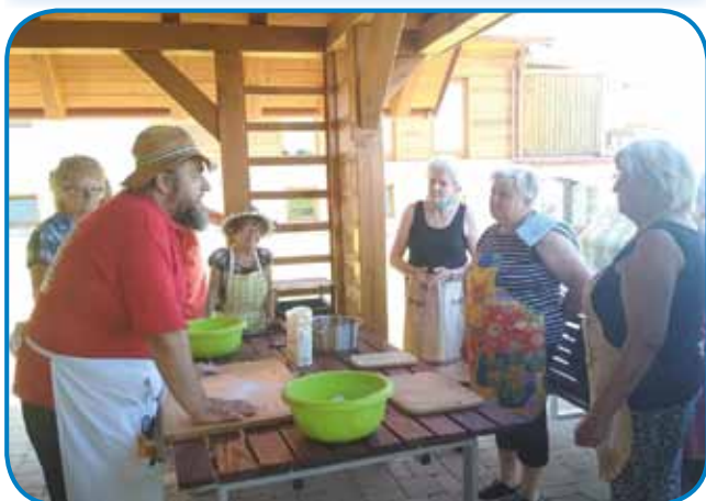
Dobri tanači za najbolja praktično pripravleno, žmano pice