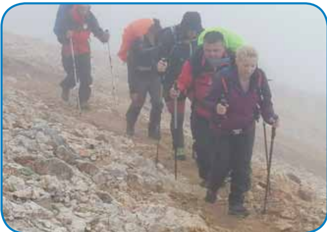
Na pauti prauti Kredarici

Triglav je simbol, šteri združuje ves slovenski narod, tak tüdi zvün meje živejo Slovenci, zaved-