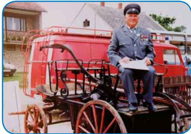
Njeni mauš Ferenc Makoš ali kak so ma v vesi gunčali Caci, je duga lejta bijo gasilec

- Tak vejim, ka vaš mauš so dosta kejpov redli, leko bi