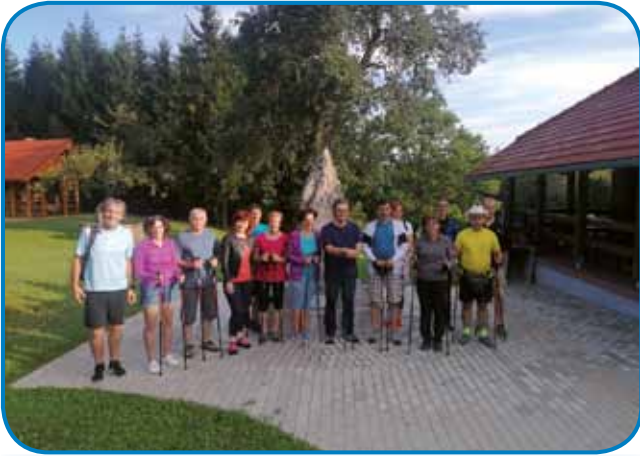
V srejšdo rano smo se napautili od Maloga Triglava v Andovci

venije, steri zdaj že sedmič pomagajo nam pridi na vrh Triglava. Naslednji den, v soboto zaranka smo štartali pa kauli tretje vóre