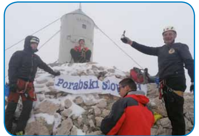
Srečni pri Aljaževom stolpi

smo prišli do Krederice. Vreme je lejpo bilau, malo oblačno, malo je rosilo, idealno za pohod. Depa potejn se je vrag skazo, gda smo se kreda dejvali, ka demo na vrh, gnauk samo veter začno fuditi pa dež se je püsto. Vodniki so prauto vreka kazali, aj gledamo, kak tam snejg de, od tauga so se edni malo prestrašili, spoj pa te, gda so še prajli, ka vrkar je že mraz