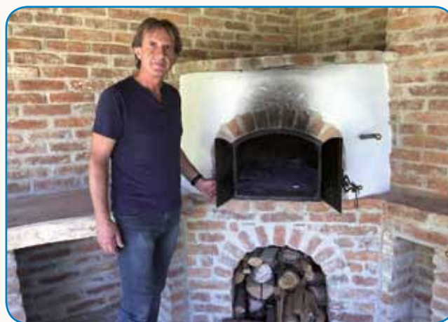
»Človek doma, kaulak rama vsikdar nika dela ...« stran 9