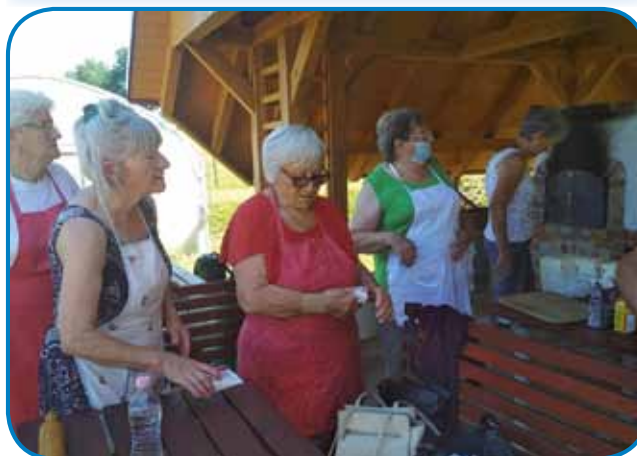
Steri so že zgotovili z delomb