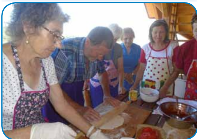
Na red smo stali za delo s testaumb