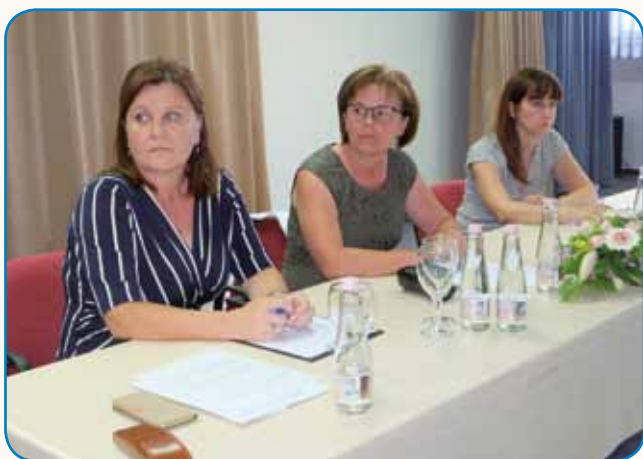
Nenavadna situacija postavlja organizacijo pred nove izzive stran 3