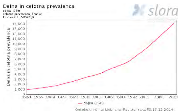
Slika 3. Prevalenca raka dojke v letih 1961-2011.

Medtem, ko je bila incidenca raka dojke v Sloveniji pred pojavom DORE nizka (slika 2), pričakujemo bistveno zvečanje, ko bo pokrila celotno ciljno populacijo žensk. S tem se bo zvečala tudi prevalenca žensk z rakom dojke. Prevalenca (število živih bolnic, ki so kadarkoli prebolele rak dojke), se je od leta 1961 zvečevala in je leta 2010 znašala 14 000 (slika 3). Bistveno vlogo pri interpretaciji pomena DCIS ima onkolog, ki bolnico zdravi. Predstaviti ji mora, da je to neinvazivni rak, ki ga je potrebno odstraniti, da ne bi nastal invazivni rak. K ločitvi DCIS od invazivnih rakov bi pripomogla klasifikacija DCIS izven sklopa raka dojke, z oznako, ki ne bi vsebovala besede karcinom. Bolnice bi to najverjetneje sprejele z olajšanjem. Tudi v strokovnih krogih obstaja dilema glede DCIS: a je rak, prekursor raka ali le marker za večji riziko za rak dojke 17 .