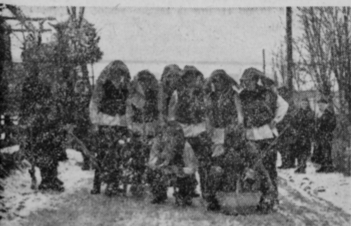
Orači iz Markovec se nekoliko razlikujejo od oračev iz Lancove vasi. Njihovi konjički so ravno tako veseli, vendar drugače oblečeni. Obiščejo tudi vsako dvorišče, »obračuna« pa za njihovo oranje pobirač, ki tudi poseje, pograblja in pobere jajca, klobase pa tudi denar.