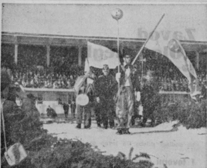
Skupina skoromatov iz Kostanjevice je 1965. leta prvič nastopila na ptujskih folklornih prireditvah in je bila prav zanimiva tako po svojih likih kot tudi po vsebini svojega pustnega obreda.