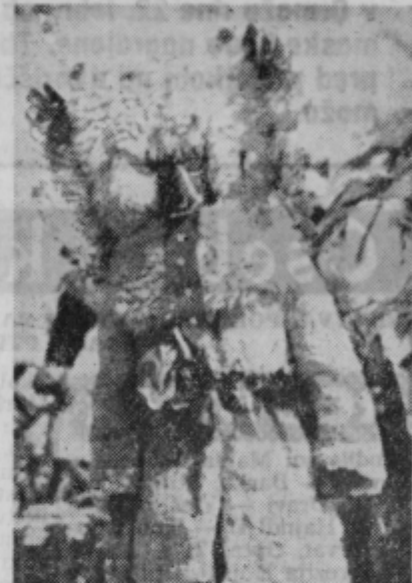
Kurent je pošasten lik pustne maske, pa ne samo zaradi grozljive opreme, temveč tudi zaradi tega, ker malo kdo ve, kdo je kurent.