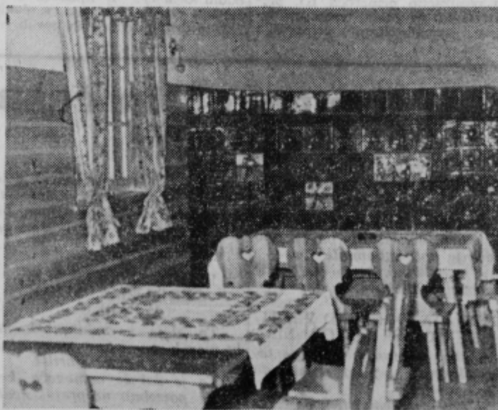
Kmečka soba v grajski restavraciji je eden izmed lepo urejenih in za turiste zelo privlačnih gostinskih prostorov, ki je vedno poln do zadnjega kotička zlasti ob ptujskih prireditvah pa tudi v turistični sezoni. Marsikateri mladi par pride v to sobo na poročni dan in se s svojimi gosti v njej prav prijetno počuti, čeprav ga potem račun nekoliko »olajša«.