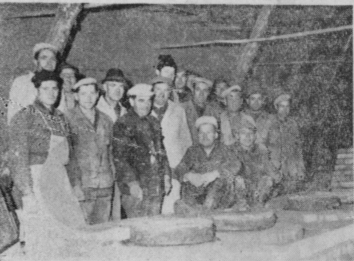
Zidarji Građenj pri gradnji nove peči za Opekarno Zabjak