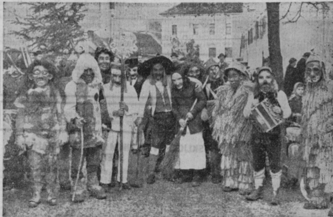
Laufarji iz Cerknja so prav zanimiva skupina, ki jo vidimo že več let na ptujskih prireditvah. Neme maske so deležne vse pozornosti gledalcev in snemalcev, v resnici pa jih predstavljajo mladi, prav veseli in živahni člani skupine.