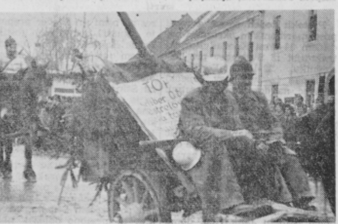
S I. ormoškega karnevala

Za pustni karneval v Ormožu je vse pripravljeno. Pričetek bo na pustni torek, 22. februarja, ob 14. uri. Najboljše skupine in posamezniki bodo nagradjeni. Na karneval so vabljeni vse pustne skupine in posamezniki iz občin Ormož, Ptuj in Ljutomer. Karnevalski sprevod bo krenil z dvorišča bolnišnice po Ptujski cesti na Mestni trg, kjer bo nastopajoče ocenila 5-članska komisija. Po programu bodo skupine in posamezniki nadaljevali pot po Kolodvorski ulici, mimo bencinske črpalke, po Vrazovi ulici in nazaj na Mestni trg, kjer bo ponoven prikaz skrajšnega programa. Po programu bo ocenjevalna komisija nagradila najboljše skupine in posameznike. Ob tej priložnosti bo razdeljenih več denarnih nagrad. Mestni trg bo primerno urejen. Bo ozvočen in prihod sleherne pustne skupine ali posameznikov bo pojasnjen.