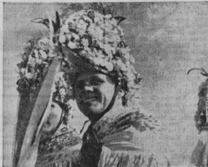
Orači iz Lancove vasi so predstavniki pustnih običajev z Dravskega polja. Ob pustnih dnevih so razveseljevali prebivalce iz Lancove vasi in iz okoliških vasi s svojimi konjički, kurentom in oračem ter pobiračem. Posebno lepe so njihove kape, okrašene z gosti vanjskimi pušeljčki.