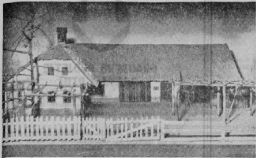
Maketa podeželske hiše panonskega tipa iz okolice Ptuja, v kateri je družinska soba (hiša), kuhinja (priklet) in zadnja soba (štibelc), hlev, skedenj in svinjak.