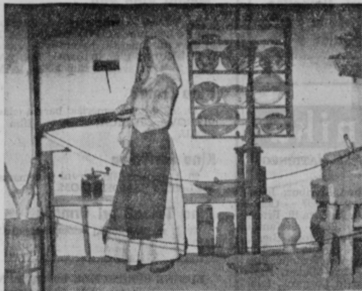
Kuhinja (priklet) je za vsako kmečko gospodinjico najvažnejši prostor. Pregrajena je največkrat z zidom, da se pri vstopu v hišo ne vidita peč niti gospodinja. V njej je ves kuhinjski pribor, ki je razpostavljen po lesenih policah. Tudi v Pokrajinskem muzeju v Ptujju je tako urejena kuhinja in v domačo nošo oblečena ženska pred kmečko pečjo, obdana z lončenimi lonci, burkljami in žrmljami in drugim. Priklet pravijo zato, ker so v tleh tega prostora vrata v klet.