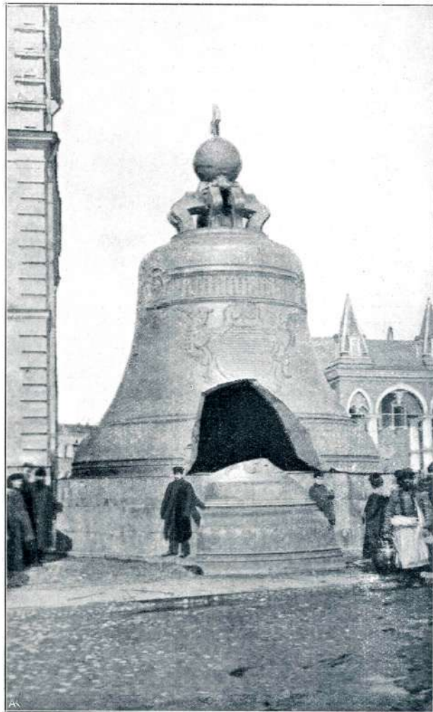
Moskva: Car kolokol.

S ponosom zre Rus na svoje največje narodno svetišče. Kreml je »okamenela zgodovina ruske države«; bil je priča vse sreče, pa tudi vse nesreče, ki je Ruse zadela. Moskva je združila vse ruske rodove v veliko državo; sama sebi je pridržala prvenstvo, medtem ko so druga mesta izgubila ugled. Čim bolj pa je rastla moč ruskega carstva, tem bolj je naraščala tudi Kremlova slava. Ko se je Peter Veliki s carskim dvorom preselil v