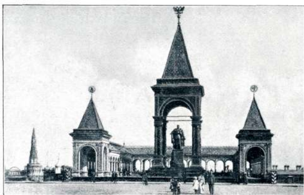
Moskva: Spomenik Aleksandra II.

Na trgu pred Ivanom Velikim nas zadržujejo razni nadležniki: prodajalci razglednic, zgovorni ciceroni, limonadar in slaščičar, pa tudi slepi in