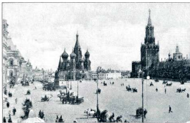
Moskva: Rdeči trg, cerkev Vasilija Blaženega in Zveličarjeva vrata.

Posebno hudo je divjal Ivan Grozni, ruski Neron. Na stotine plemenitašev in drugih »zarotnikov« je pomoril na Rdečem trgu. Meščani so morali biti navzoči, ko so »hudodelci« umirali v najstrašnejših mukah; krvoločni car pa je s krem-