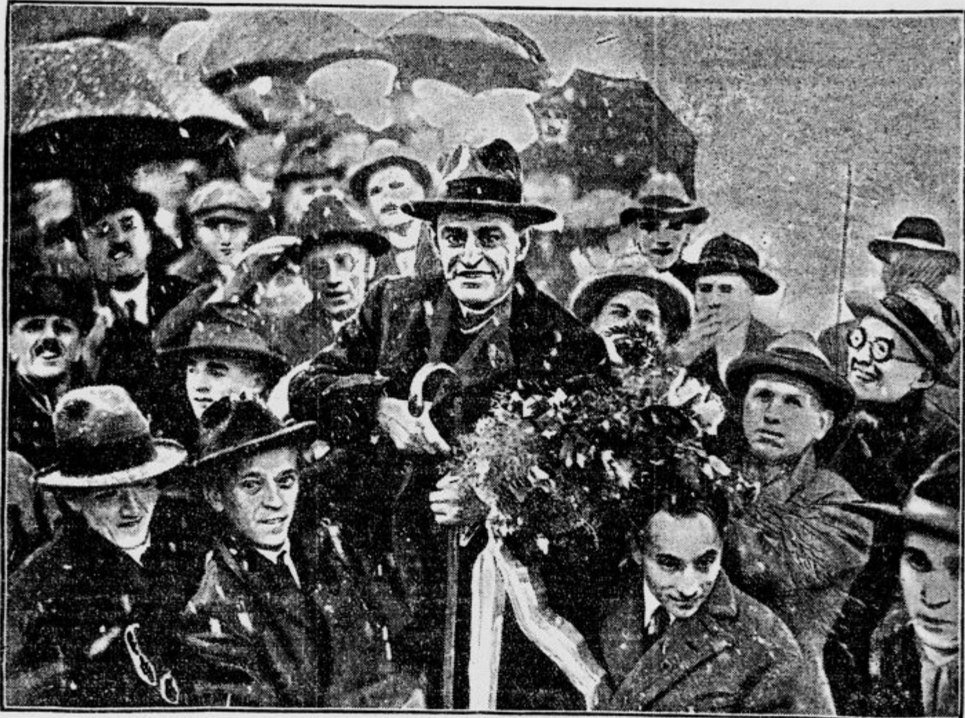
Svetozar Pribičević v povorki obdan od oduševljene omladine.

Dnevni red današnjega zbora je, da čujemo govore naših dragih voditeljev iz Beo-