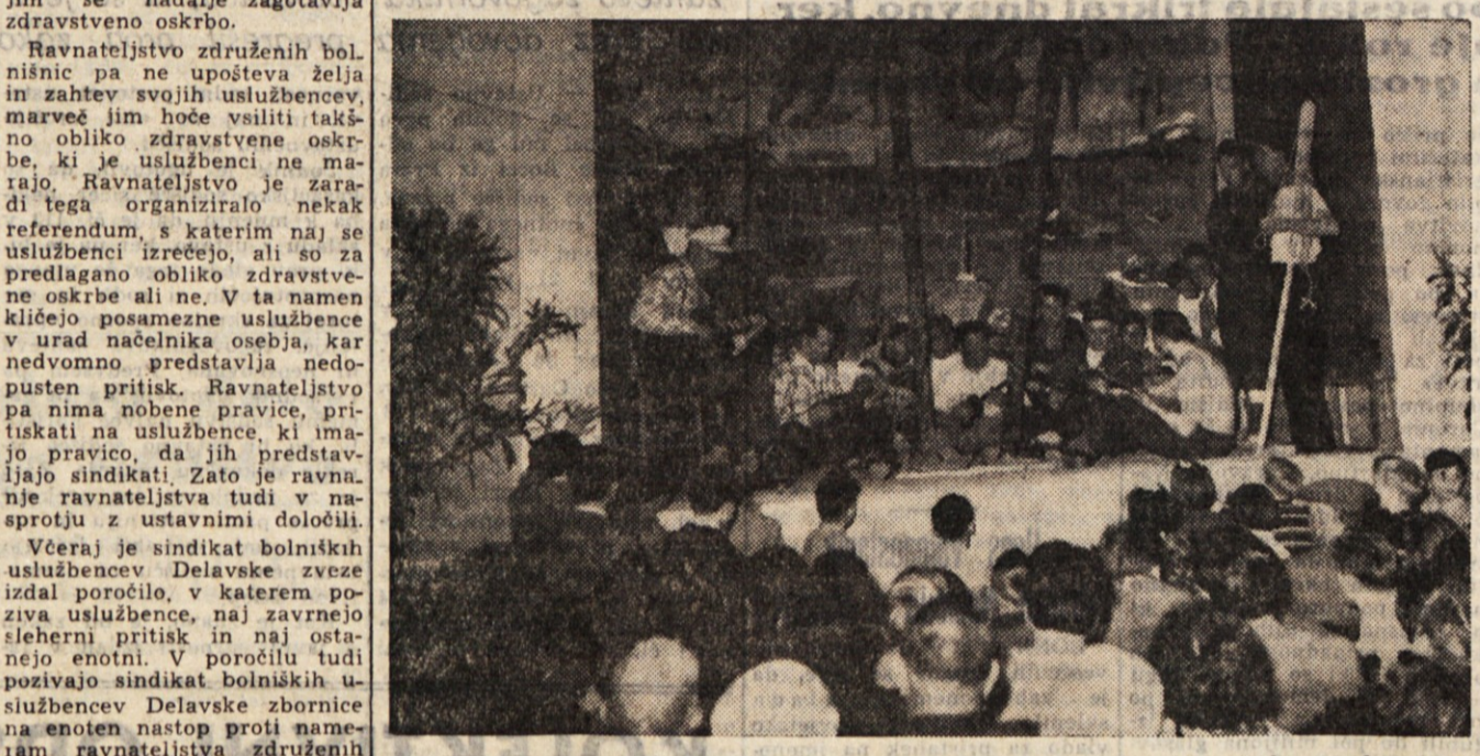
Prizor iz tretjega dejanja; očet je ob spremljavi tamburašev dalmatinske narodne pesmi

Prireditev bodo na zahtevo občinstva ponovili ter se z njo predstavili tudi po drugih vaseh in v mestu - Tradicionalno slučanje