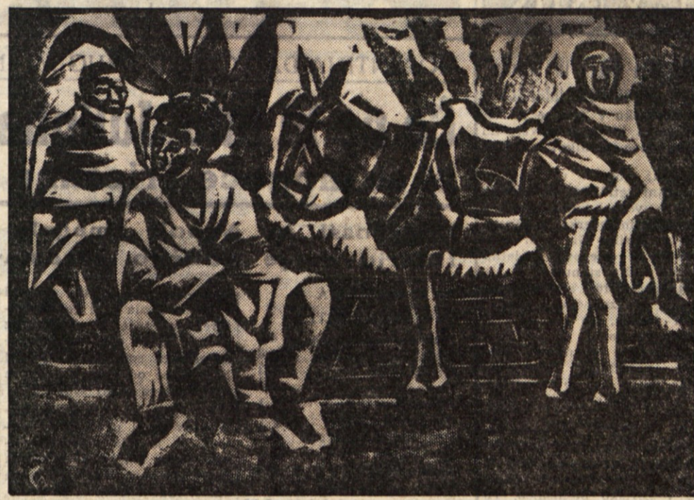
Od 1. do 15. prihodnjega januarja bo v ljubljanski Mali galeriji razstavljal svojo grafiko znani tržaški slikar A. Černigoj. Na sliki linorez iz mape linorezov in lesorezov »Afrikan«.