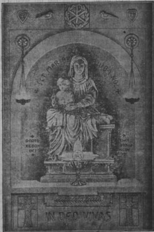
Mati boža iz Kartagine, gde je zemlja spila teliko mantrniške krvi i gde se vrši od 7.—11. maja velki evharištični kongres.

Letošnji evharištični kongres je že 30. Začnoli so se na Francoskom l. 1881 v mestu