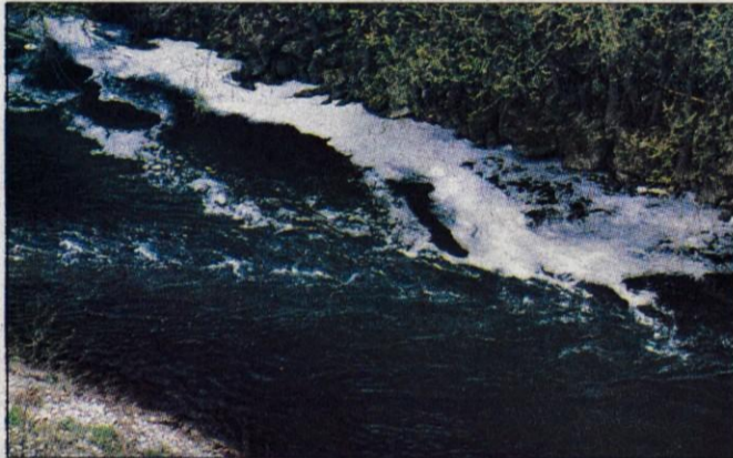
Belo peno, ki je minuli četrtek prekrivala reko Kokro, je zakrivil izpust iz tovarne Ibi.

Kranj, 24. aprila - Mimoidoči so minuli četrtek pogosteje pogledovali v kanjon reke Kokre, kjer so imeli kaj videti. Reka je bila namreč prekrita z večjo količino bele pene. "Nezaslišano, spet si je nekdo privoščil izpust. Očitno so kazni tako nizke, da se podjetja ali zasebniki požvižgajo nanje," je bilo slišati med komentarji. Ni kaj, lep uvod v dan Zemlje. Naš odnos je milo rečeno mačehovski in še dobro, da obratno ni tako.