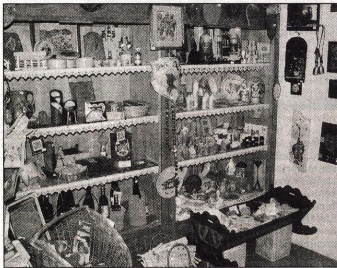
Ponudba turističnega društva Škofja Loka.

Usodna za lansko poslovanje škofjeloškega turističnega društva pa se je izkazala odločitev, da prijetne poletne večere z glasbo ob koncih tedna preselijo z Mestnega trga - izpod Homanove lipe, na grajski vrt, ki kljub prelepemu prizorišču za prireditve vse od ukinutve Izselskega piknika večinoma sameva. Organizirali so skupino članov društva, ki so ob pomoči vrtnarjev uredili in polepšali ta vrt, nato pa pripravili osem koncertov. Vendar so jih izpegljali le pet, saj jim je ponagajalo vreme. Žal so odpadli predvsem tisti, pri katerih so zaradi splošne popularnosti izvajalcev pričakovali največji obisk. Vsi jim priznajo, da je bila organizacija naravnost vzorna: poskrbeli so za varnost, za sanitarije, za ozvočenje, za sprotno in takojšnje čiščenje prizorišča in