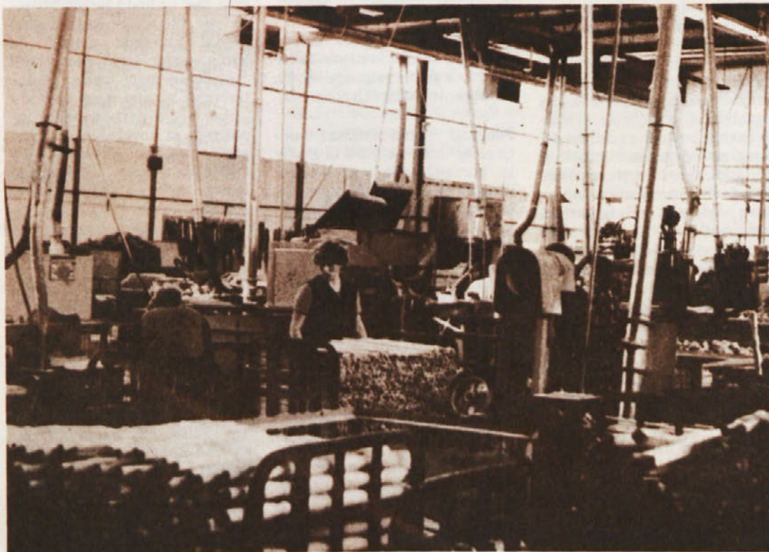
TOZD TDP – Pogled v strugarski oddelek

Kar zadeva politiko delitve sredstev za osebne dohodke in spoštovanje družbenega dogovora o delitvi dohodka in osebnih dohodkov, je očitno, da bo prekoračiteljev dogovora več kot lani. Podatki bodo znani po 15. avgustu, udeleženci posveta so se zavzeli, da je treba skladno s sindikalnimi stališči prekoračitelje obravnavati dosledno, kršitelji pa bodo morali preveč izplačane osebne dohodke poračunati. Res pa je, da so v občinah doslej kršitelje ocenjevali z različnimi merili. Udeleženci posveta so ugotovili, da je bil pritisk na povečevanje osebnih dohodkov v prvem polletju velik, predvsem zaradi naraščajočih življenjskih stroškov pa tudi zaradi govorice o možni zamrznitvi osebnih dohodkov. Očitno pa je, da osebnih dohodkov dolgoročno ni mogoče povečevati brez ustreznega povečanja dohodka. To seveda pomeni: narediti več in bolje, več izvoziti in podobno. Za sindikalno akcijo pa je pomembno, kot je dejal eden od razpravljalcev, da osnovne organizacije sindikata v ozdih kljub jasnemu stališčem republiškega sveta ZSS nimajo trdnih stališč o delitvi osebnih dohodkov v svoji organizaciji, imajo tudi premalo podpore od drugih družbenopolitičnih organizacij. Posebej je zanimivo, da je precej prekoračiteljev dogovora o delitvi dohodka tudi med izgubarji.