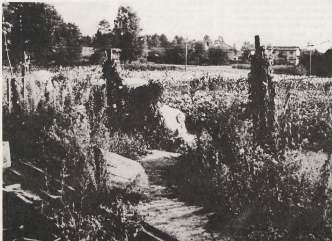
Eden izmed številnih „ilegalnih“ prehodov