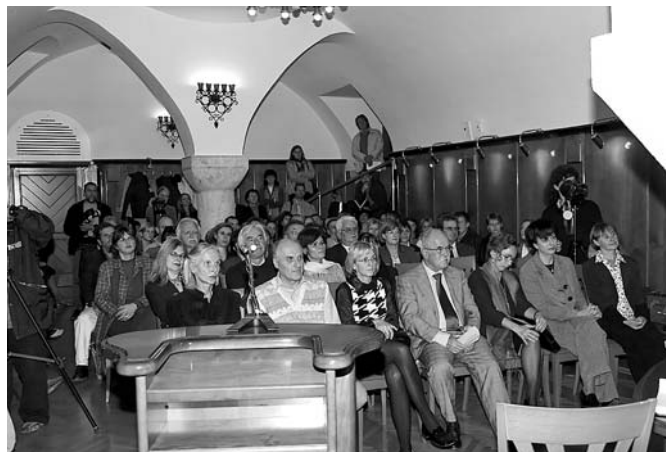
Polna Prešernova dvorana SAZU: podelitev Murkove nagrade, Murkovega priznanja in Murkove listine je dogodek, ki se ga udeleži veliko etnologov in simpatizerjev. Imena dobitnikov so zapisana v »Murkovo« knjigo.