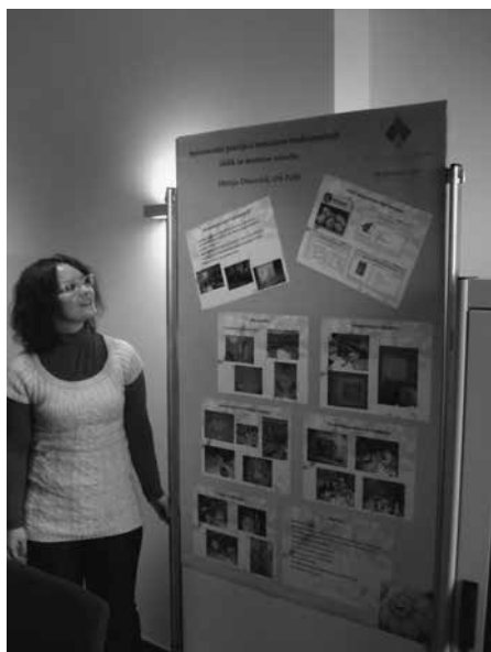
Slika 2: Plakat Spoznavanje pravljic z mešanjem tradicionalnih oblik in moderne tehnike.