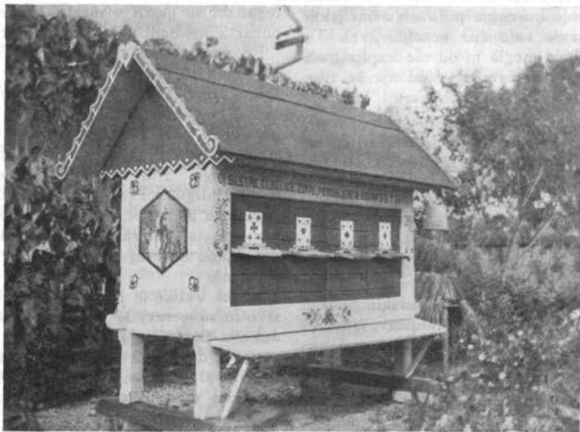
Čebelnjaček g. Blaža Kantušerja.

pa mojim boljšim trem četrtinam nikakor ni ugajalo in smo se zaradi tega večkrat kaj zmenila. Vse to je bilo povod, da sem obdržal samo 4 A.-Ž. panje in napravil nov čebelnjak, ki je zložen iz osmih delov, kakor ga kaže priložena slika. Streha se odpira kakor kovčeg in imam v podstrešju spravljeno vse potrebno orodje razen točila in stiskalnice. Stra-