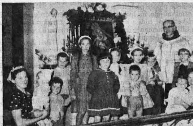
Spomin na romanje v Watson's Bay.

NASLOV LISTA „MISLI“: 66 Gordon St., Paddington, N.S.W.