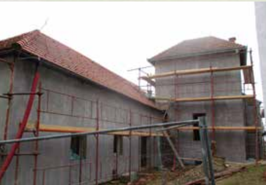
Energetska sanacija Košarkine hiše na Kogu