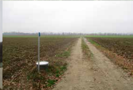
Izgradnja IV. faze namakalnega sistema