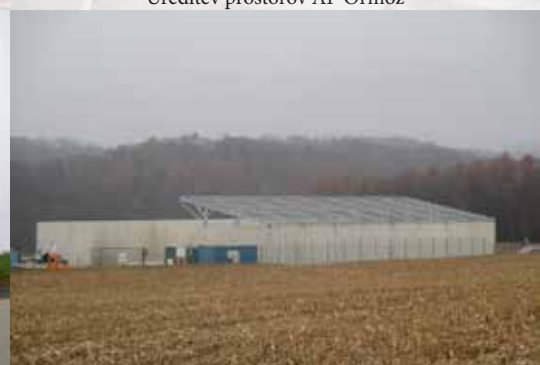
Zbirni center Dobrava