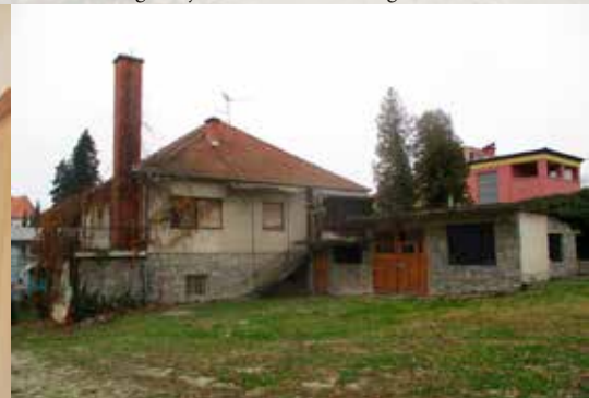
Odkup Kolaričeve hiše