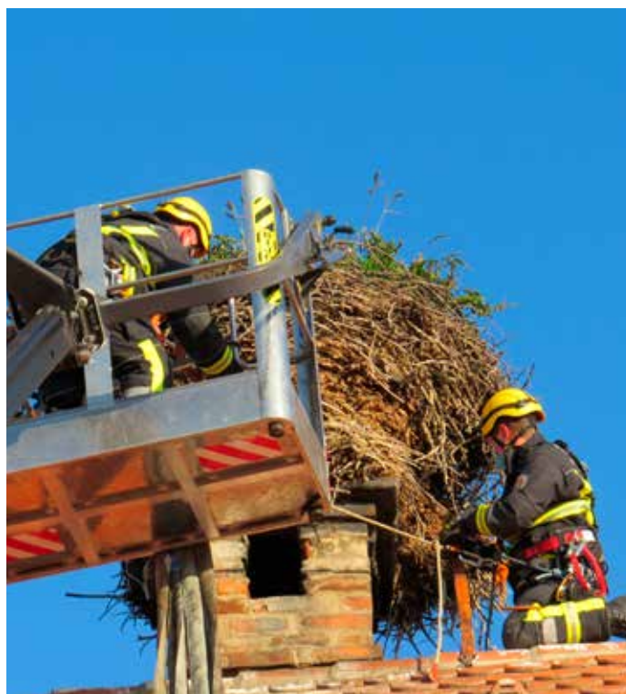
Reševanje gnezda na Kerenčičevem trgu 1