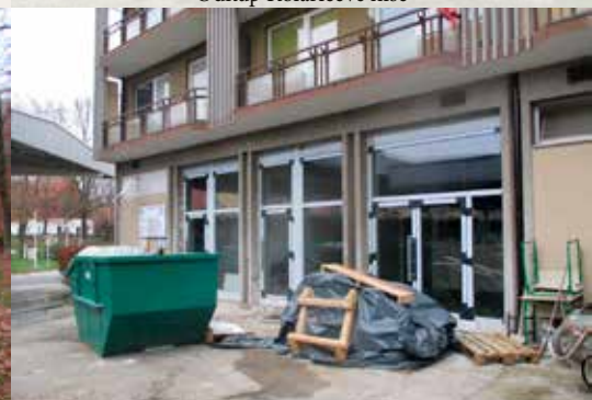
Ureditev prostorov AP Ormož