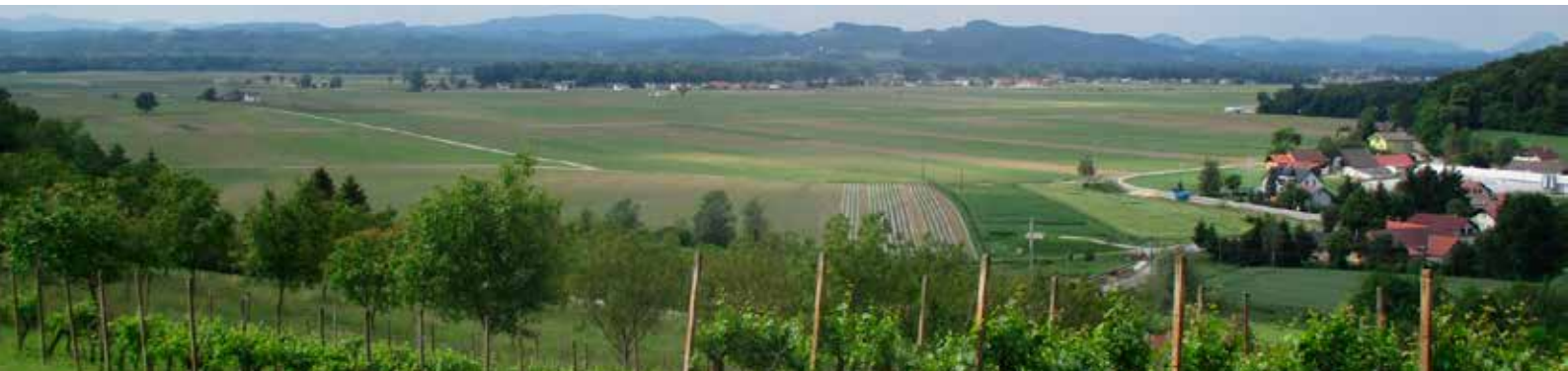
Agromelioracija Sodinsko polje