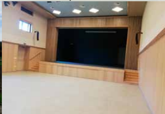
Obnova kulturnega doma Miklavž