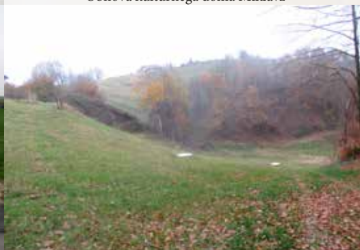
Sanacija plazu Vičanci