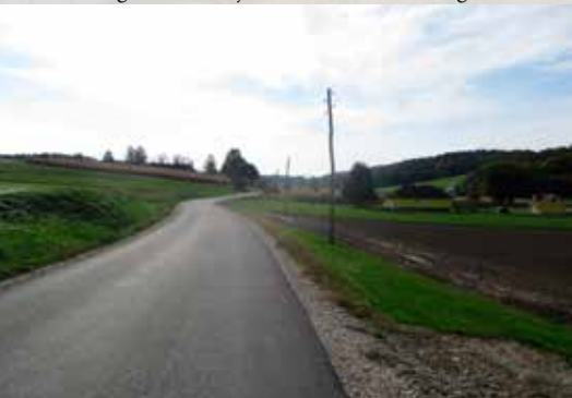
Modernizacija cest v letu 2020 v dolžini 5,3 km