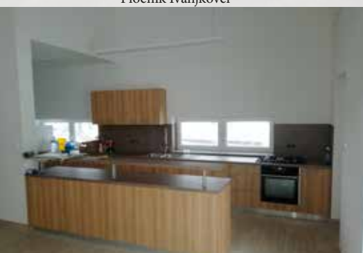
Vaški dom Pavlovci notranjost