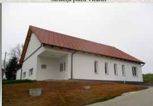
Vaški dom Pavlovci