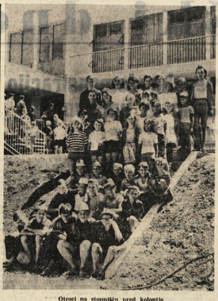
Otroci na stopnišču pred kolonijo