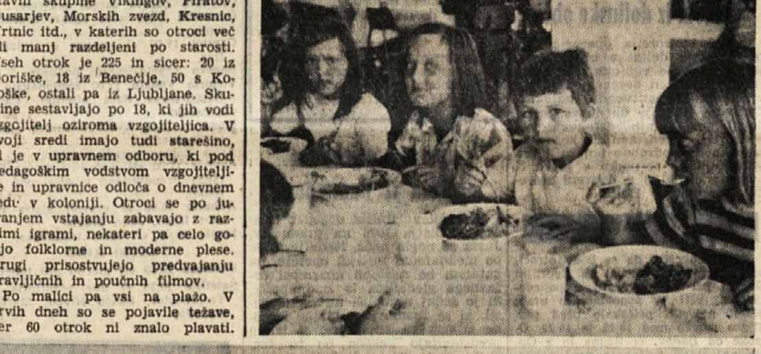
Zgoraj otroci pri kosilu, spodaj moderno urejena stavba, ki jo upravlja Zavod za počitniška letovanja Ljubljana - center

Po malici pa vsi na plažo. V prvih dneh so se pojavile težave, ker 60 otrok ni znalo plavati.