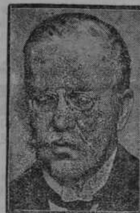
Novi predsednik Švice Edmund Schulthess. — Levo: Cesto samo za avtomobile so zgradili v Združenih državah med mestoma Jersey in Newark. Cesta je stala 17 milijonov dolarjev.