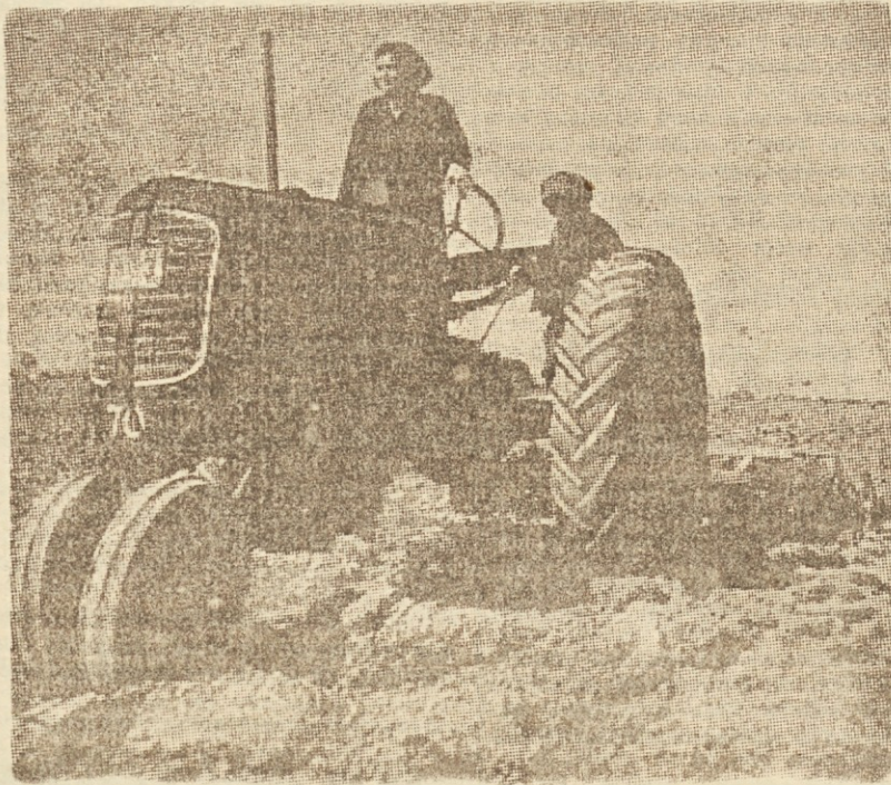
Prve brazde na naših njivah

4. Naše organizacije v strojotraktorskih postajah morajo skrbeti, da bo obdelana prvenstveno zemlja državnih posestev, poljedelskih proizvodnih združenj, zemlja kolonistov in agrarnih interesentov ter končno tudi vsa ostala zemlja.