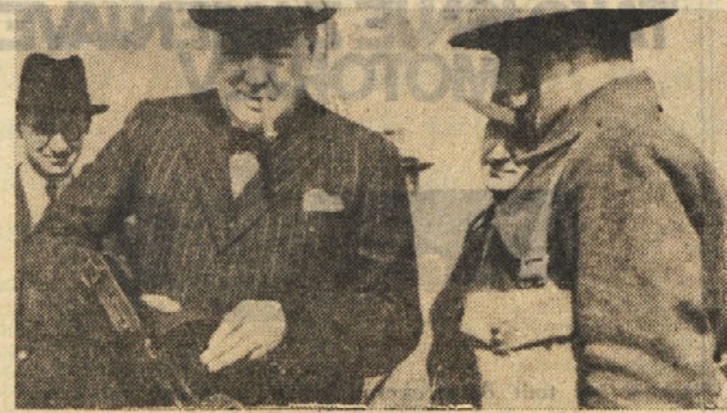
Churchill leta 1940