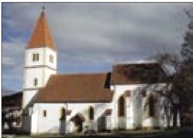
Gračka (inda gornjelendavska) farna cerkev Marije Vnebovzete z južne strani, 14./15. in 18. stoletje

V 14. veki so trno močni Széchyj, grofovsko familija, štera je dala mnogo pomembnij banov, hrvačkij ercegov pa vogrskij palatinov (nádor), mogli staro cerkev prezidati. Staro romansko cerkev so po novoy gotskoj modi povekšali ali pa bar malo zdignoli, takše fele pa je mogo biti tüdi prvi gotski prezbiterij, oltarni tau. Je pa istina, ka so brž pred sredinov 15. veka oltarni tau ešče ednok povišali, ga trno lepau napravili z zvezdastim völbom, šteroga poleg drugij vküp drži sklepnik z grbom (címer) erešnje grofovsko familije Széchy. S tem je vö dano, ka so oni bili tisti patroni, tou so tüdi ostali do kraja 17. veka, zavolo šterij ma cerkev trno pomembno preminočnost. V Gradi mamog nes edinstveni eksemplar