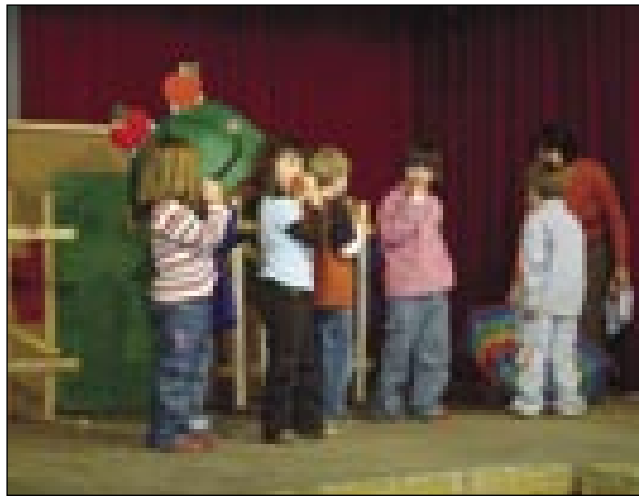
Malčki iz Murske Sobote so zašpilali igro Za ograjo sosedovega vrta

Po programi smo pod vodstvom vzgojiteljic iz Sobote vsi vtjüper špilali, plesali pa popejvali. Bili so med našimi najmlajšimi, steri so malo djaukali, se malo nazaj vlekli. No, tau sploy nej čüda, vej se