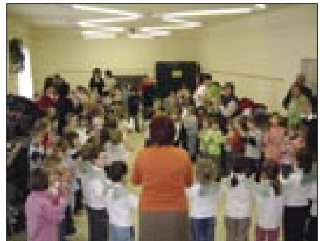
Na koncu programa so se otroci iz Murske Sobote in Porabja skupaj igrali

Na Slovenskoj zvezi smo si gora djali, ka mo zvöjn toga probali štja drüdjte poti iskati, naj se mali mlajši med seov večkrat leko srečajo, se spoznavajo pa probajo komunicirati. Prvi stopaj smo napravili na kulturnom področji. Vrtec v Murski Soboti ma