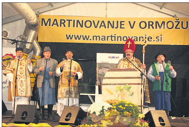
V petek in soboto so v Ormožu mošt krstili za vino.

V petek v dvorani sicer ni bilo ravno gneče, v soboto pa je bilo ves dan lepo živahno. Pred gradom in na grajskem dvorišču je potekala tudi vinska tržnica, kjer so ponujali vsa vina, ki so bila na ocenjena na ocenjevanju mladih vin in šipona, nekaj pa je bilo tudi vzorcev lan-