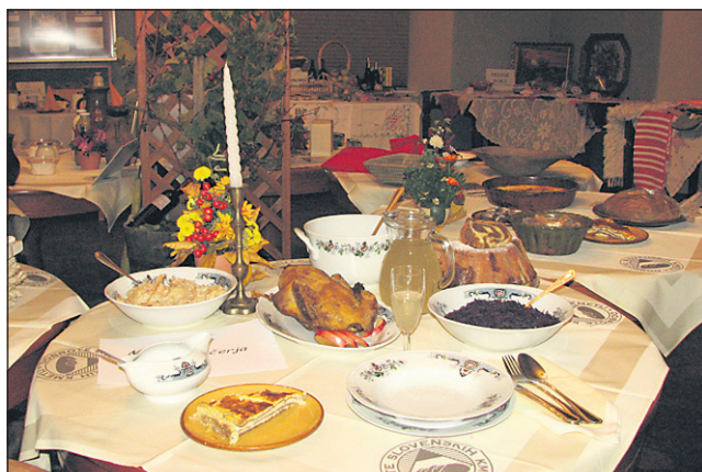
Martinova večerja je obiskovalce naravnost vabila, da se odpravijo na kakšen kmečki turizem in proslavijo martina.