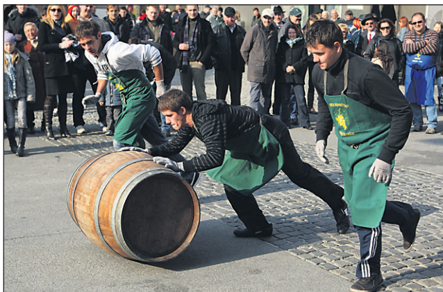
Letošnje ptujsko martinovanje je spremljal bogat kulturni in družabni program.