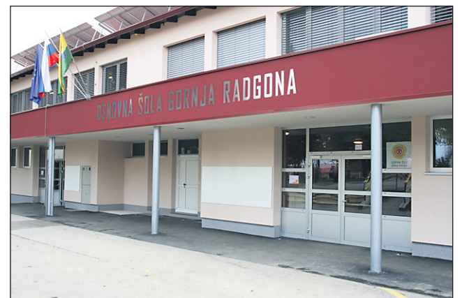
Prenovljena osnovna šola v Gornji Radgoni