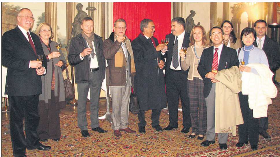
Predstavniki veleposlaništev so prišli v Ormož oboroženi s fotoaparati, s katerimi so beležili svoje vtise o kraju; odložili so jih šele, ko so dobili v roke kozarce in tako spoznali regijo tudi z drugimi čuti.

G. Radgona • Obnova osnovne šole končana