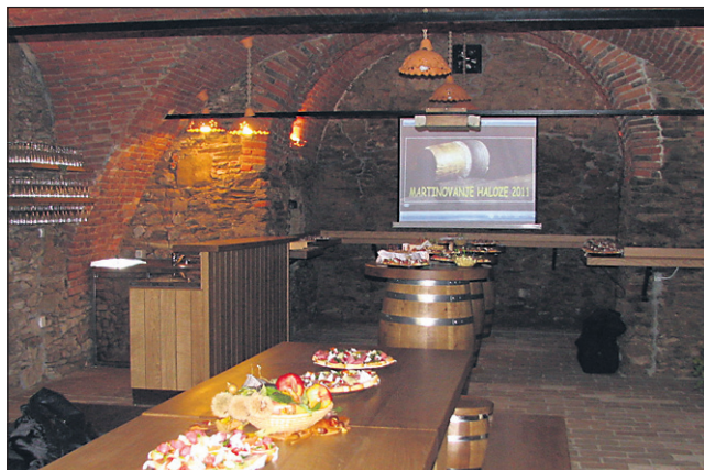
Obnova Vidove kleti je stala približno 50.000 evrov; do popolne prenove manjka le še ureditev vhodnega portala.

„Klet meri približno 80 kvadratnih metrov. Notranjost smo lani povsem uredili in opremili, zdaj pa nas čaka še nekaj dela pred vhodom. Če bo vreme zdržalo, bomo urejanje nadaljevali kar te dni, sicer pa spomladi naslednje leto. V načrtu je namreč še ureditev vhodnega podija s stopnicami, zasaditev ene od avtohtonih vinskih trt in fasado. V prenovo kleti bomo vložili okoli 50.000 evrov, pri čemer smo 20.000 evrov pridobili z uspešno prijavo projekta na razpis LAS Haloze, razliko pa smo finančno kompenzirali z najemnino, kar pomeni, da obnova kleti občinskega proračuna prav-