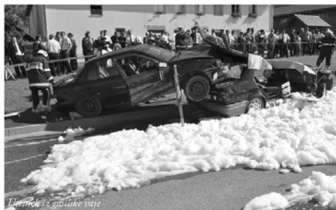
Učenci iz gasilske vaje

Prireditve se je začela z reševalno vajo, v kateri so sodelovala tudi druga društva. Po vaji je bil častni postroj gasilcev in gasilk, katerim so sledili štirje padalci Aerokluba Ptuj: Aleš Zamuda, Boris