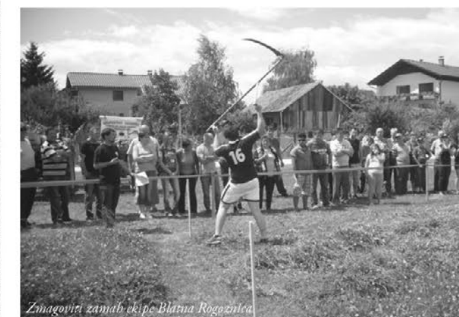
Zmagoviti zamah ekipe Blatna Rogoznica