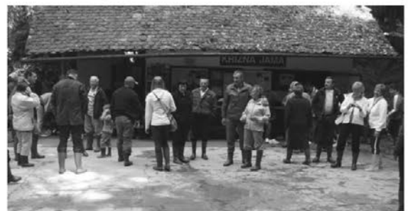
Priljubljeni na ogled Križne jame

V turističnem društvu vsako leto organiziramo kakšen izlet. Letos smo si ogledali zbirke Tehniškega muzej Slovenije v Bistri pri Vrhniki. Največ zanimanja so pritegnili avtomobili, ki so bili nekoč v Titovi lasti. Manj znana, a občudovanja vredna, je Križna jama, po kateri se je mogoče popeljati s čolnom, v spominu so nam ostala tudi številna okostja jamskih medvedov.