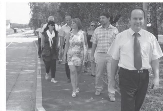
Z poslanci SDS smo si ogledali bližnjo okolico centra Trnovske vasi