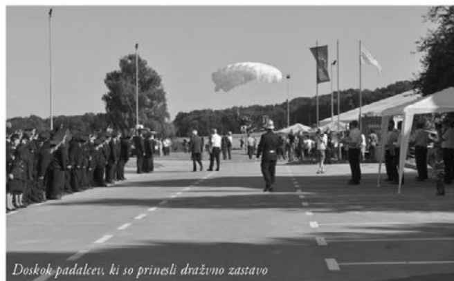
Doskok padalcev, ki so prinesli državno zastavo