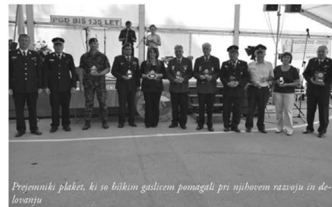
Prejemniki plaket, ki so biškim gasilcem pomagali pri njihovem razvoju in delovanju