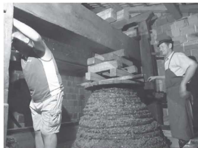
V objektiv nam je uspelo ujeti prešanje grozdja kot je bilo nekoč