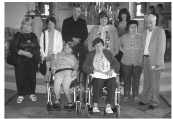
Stanovalci DBE, ki so ob nedeljah navzoči pri sveti maši, so prisli pozdraviti novega gospoda župnika

Člani so se v letošnjem poletju udeleževali raznih projektov, med njimi so izlet na Kope, kjer so med drugim kuhali marmelado. V avgustu so imeli romanje na Ptujsko Goro, kjer je bilo letos že šesto romanje zavoda. Potem so se udeležili še izleta na slovensko primorje in še kaj bi se našlo.