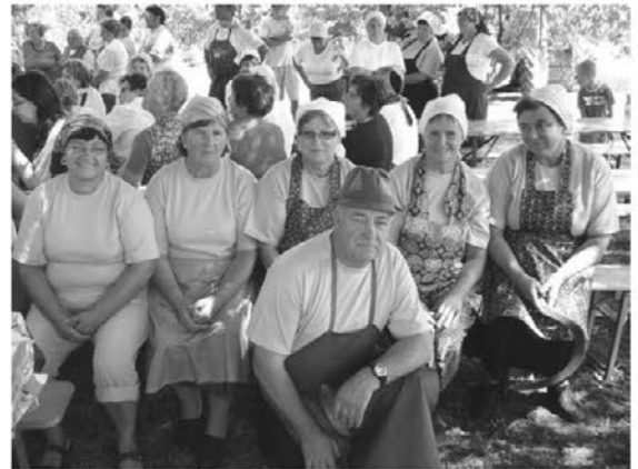
Nepopolna ekipa na drugem kmečkem prazniku v Trnovski vasi

Naši člani so številčno sodelovali tudi na prireditvi OD BRAZDE DO KRUHA. Prikazali so ročna opravila, ki so bila v naših krajih prisotna še pred nekaj desetletji in na humoren način zabavali zbrane.