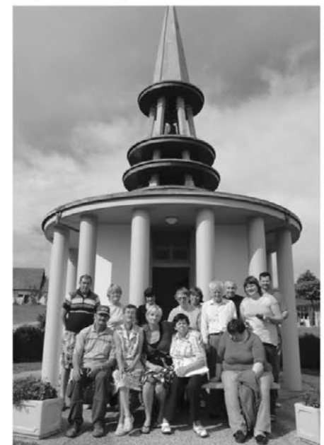
V sklopu projekta »Spoznavajmo okolico« so si stanovalci ogledali tudi kapelo v Sovjaku

Decembra bodo minila štiri leta odkar v naši občini deluje Dislocirana bivalna enota (DBE) Socialno varstvenega zavoda Hrastovec. Že od samega začetka so se stanovalci s pomočjo zaposlenih aktivno vključili v utrip in življenje lokalne sku-