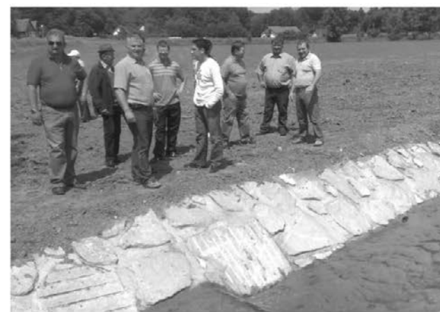
Glavni akterji projekta so ponosni na novo posodobitev potoka

Tisti, ki živijo ali pa imajo svoja zemljišča v neposredni bližini Ločkega potoka, so končno dočakali njegovo temeljito obnovo. Svoje veselje ob zaključku tega projekta so lastniki zemljišč v bližini potoka pokazali, ko so se skupaj s predstavniki občine, predstavnikom Agencije RS za okolje in predstavniki izvajalca VGP Ptuj, 18. maja