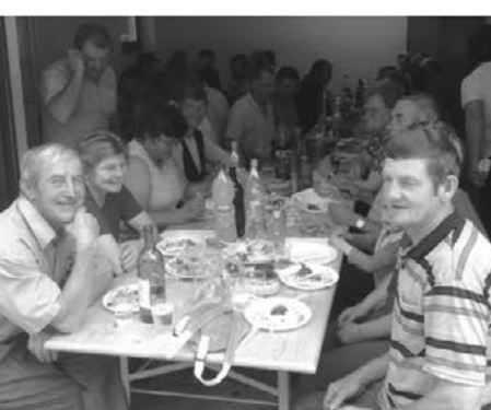
Na koncu uradnega dela so se navzoči kot se spodobi okrepčali in osvežili

Potok, ki je bil že precej zapuščen in zarašččen so poglobili, očistili in utrdili brežine, saj je ob večjih nalivih njegova struga pogosto prestopila bregove in poplavljala kmetijska zemljišča ob potoku.