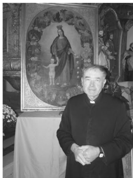
V mesecu oktobru je novi gospod župnik v cerkvi pripravil oltar za čaščenje »rožnovenske Matere Božje«

Rodil sem se v vasi Kostanjevec pri Slovenski Bistrici, to je vas, ki je tako rekoč pod Pohorjem. Nad našo vasjo se potem začne dvigati pohorski greben. Rodil sem se 5. oktobra 1948, osnovno šolo sem obiskoval v domačem kraju, v domači župniji, to je Zgornja Ložnica ali starodavno ime je Sveti Venčes. Potem sem šel v srednjo kovinarsko šolo v Slovensko Bistrico, ki pa je nisem končal. Po drugem letniku kovinarske šole sem se namreč odločil, da grem