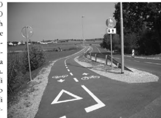
Kolesarska steza smer Biš

smeri je znašala približno 650.000 €, od katerih je bilo okoli 514.000 € pridobljenih iz nepovratnih evropskih sredstev s strani Službe vlade Republike Slovenije za lokalno samoupravo (SVLR), preostanek sredstev pa je zagotovila Občina Trnovska vas iz proračuna. V nadaljevanju se bodo naredili projekti v smeri Biša in Ločiča, ob regionalni cesti, ki bodo zajemali