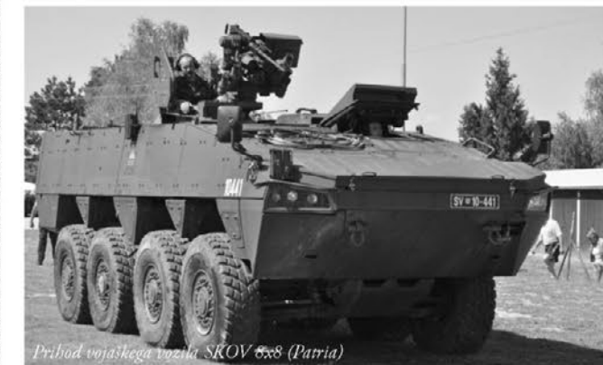
Prihod vojaškega vozila SKOV 8x8 (Patria)