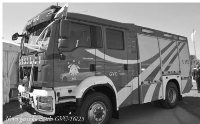
Novo gasilsko vozilo GVC-16/25