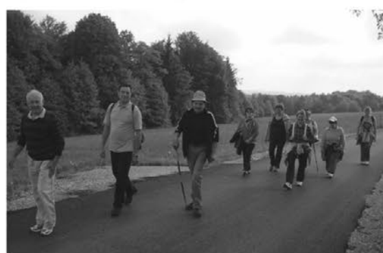
Pobod na Zavrh – 1. maj