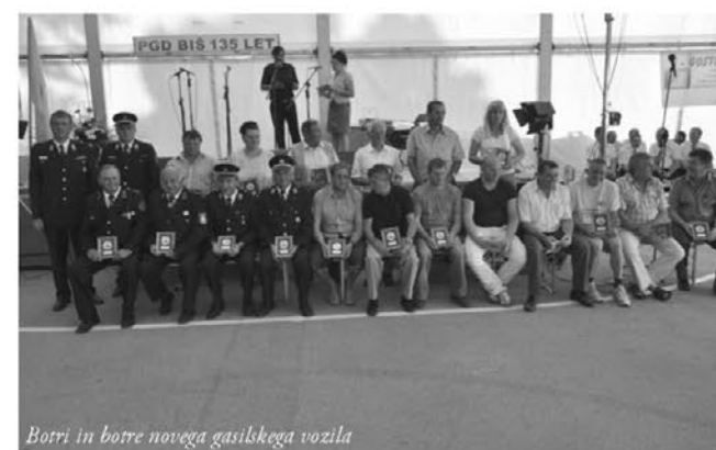
Botri in botre novega gasilskega vozila