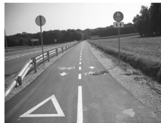
Kolesarska steza smer Ločič

izgradnjo pločnikov, javne razsvetljave, električnih in telekomunikacijskih vodov ter kanalizacije. Vsi infrastrukturni vodo bodo izvedeni zemeljsko, tako da ne bodo kazili okolice in motili okoliških prebivalcev. Zaradi izgradnje čistilne naprave v Bišu, katere projekt je v zaključni fazi in se navezuje na tudi prej omenjeno širitev kanalizacijskega omrežja, naprošamo vse lastnike zemljišč za potrebno oddajo soglasij, saj bo le z vašim pravoča-