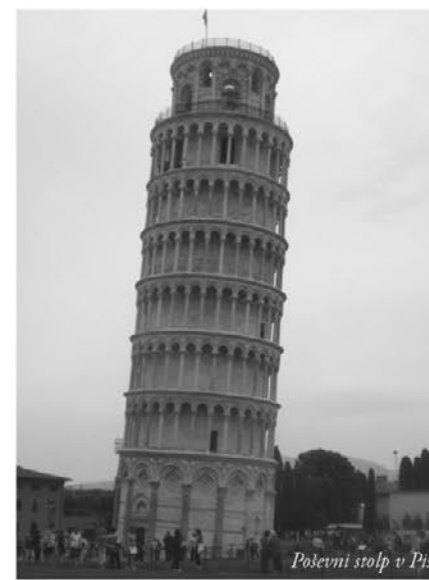
Poševni stolp v Pisi

V petek, 27. in 28. maja je Občina Trnovska vas na pobudo Občinskega sveta Trnovska vas organizirala strokovno ekskurzijo: Lucca – Pisa – Cinque Terre. Zbrali smo se v petek, zgodaj zjutraj, ob 4.00. Pot nas je peljala mimo Ljubljane čez slovensko-italijansko mejo preko italijanskih regij Furlanija, Julijska Krajina, Benečija in Emilija Romanja. Naš cilj je bila Toskana, ena izmed 20 regij, ki jih uradno ima Italija in jo je vredno obiskati. Ko smo prišli v mesto Pisa, smo že od daleč videli poševni stolp, po katerem je mesto svetovno znano. Stolp se nahaja na Trgu čudes, na katerem se nahajajo tudi druge znamenitosti: bazilika, krstilnica, camposanto – pokopališče ... Slavni stolp v Pisi, ki ga letno obiše milijon turistov, so začeli graditi leta 1173. Že od vsega začetka, po 5 metrih gradnje, se je stolp zaradi nestabilnega terena in strukture tal začel nagibati. Stolp je visok 58 metrov in do vrha vodi 296 stopnic. Sedem zvonov, za katere je bilo namenjeno,