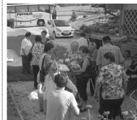
V Sovjak so priromali od blizu in daleč, iz Prihove celo z avtobusom

srečelov, katerega izkupiček je bil namenjen obnovi kapele in pokritju stroškov prireditve.