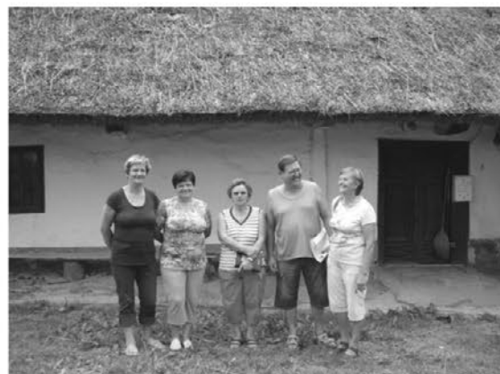
Popisovalci na Simoničevi domačiji

Z veseljem opažamo, da se v našem kraju pogosteje ustavljajo domači in tuji popotniki. Manjša skupina tujcev je to poletje z velikim zanimanjem spoznavala naše kraje, kar nam znova potrjuje, da obstajajo skupine turistov, ki se raje kot vrvežu znanih turističnih točk predajo naravi.