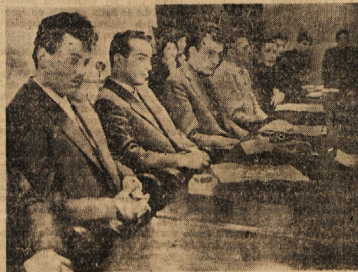
Na občinski konferenci je trboveljska mladina pregledala dosedanje delo. Letos pa nameravajo v Trbovljah dejavnost mladine še izboljšati z novimi oblikami dela - tribuno mladih, klubi volivcev; nova oblika družbenega življenja pa bodo mladinski klubi, ki jih bodo uredili mladinski aktivni in šole

V prvo vrsto bi sodile redne vozne cene, ki bodo takšne, da bodo ustrezale načelom izravnave stro-