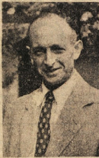
Eichmann mesec dni pred aretacijo v Argentini

Vsak znak obupa je bilo Hitlerjevo zagotavljanje, da se »sramotno« 1918. leto ne bo ponovilo, ko je Nemčija položila orožje že pred polnočjo, marveč, da se bo Nemčija borila do konca in tudi zmaga in da bo orožje, če bi morala biti premagana, »poločila šele pet minut čez polnočjo«, kar pomeni »nikoli«. In Nemci so se res obnašali do konca, kakor da ne bodo nikoli poraženi in kakor da jim ne bo nikoli treba plačati krvavega računa za zločine, ki so jih počeli vse do leta 1933 dalje s prihodom Hitlerja in njegove stranke na oblast nad notranjimi nasprotniki — komunisti, socialisti in drugo opozicijo, nato pa, ko so začeli z okupiranjem drugih držav in sprožili drugo svetovno vojno, širom po Evropi vse do »pet čez polnočjo«. O tem govorijo njihovi zločini tudi na naših tleh, saj so še v drugi polovici aprila 1945. streljali zadnje talce. V begunjskih celicah smrti, spremenjenih v muzej, sta jih na to uro opozorila tudi poslednja dva talca, streljana 17. aprila 1945, ko sta pred izvršitvijo smrtne obsodbe