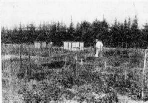
Cebelarski zavod in poizkusne parcele v Butovem pri Moskvi.

jih obravnavali z medom kakor pa, če bi jih zdravili na kak drug način. Med vojno je ta oddelek iznašel zanimive načine izkoriščanja stranskih produktov, ki nastajajo pri predelovanju voska. To izredno dobro gradivo je mogoče uporabiti pri izdelavi mazila za obutev. Med vojno se je tega mazila neobičajno mnogo porabilo.