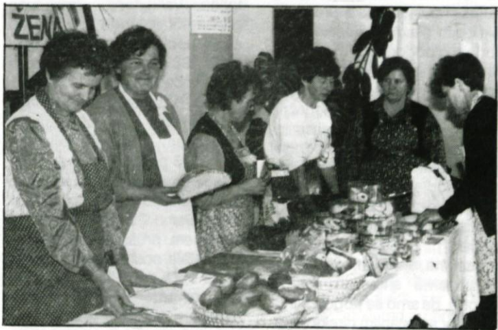
Za prodajnim pultom Aktiva kmečkih žena