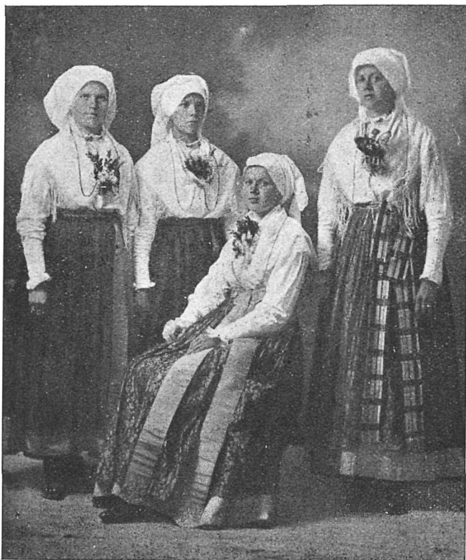
Tržaške okoličanke v narodni noši.

Kakor sem že omenila, so v začetku stoletja nosile krila iz blaga, imenovanega «bavela». To je bilo volneno, z delimi nitmi. Pozneje so pa nosile svilena črna krila z modrim svilenim trakom, dekleta vijoličasta z modrim trakom, ali pa «kanelasta» (svetlorujava) z različnimi trakovi. Čim širši je bil trak, tem finejše je bilo krilo. Na narobni strani je bil «podšiv» visok čez \frac{1}{2} m, večinoma rožne barve. Krilo je bilo široko, 4—5 m, nabrano ali na «favde» prišito na moderc drugačne barve. Nosile so po 2 spodnjici v 5 pol (5 kosov), škrobljeni in trdo zlikani. Čevlje so imele nizke, z nizkimi petami, črne «brunelaste» (blago za moške hlače). Na čevljih je bila spredaj pentlja, sešita iz modrega svilenega traka, rekli so ji «roža».