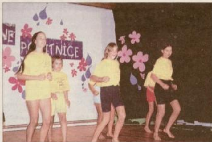
Počitniške urice so si krajšali tudi s plesom.