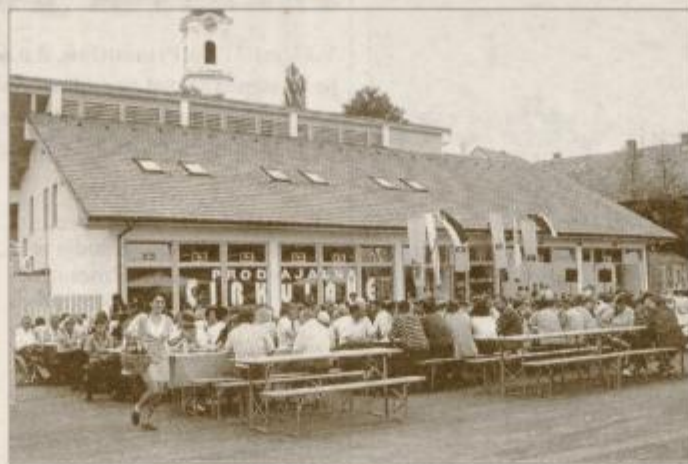
Sodoben Poslovno-prodajni center KZ Ptuj v Cirkulanah

Kmetijska zadruga Ptuj in njen upravni odbor sta se za investicijo v Cirkulanah odločila zaradi dotrajanosti dosedanjega objekta in zaradi denacionalizacijskega zahtevka. Z gradnjo novega objekta na povsem novi lokaciji so dolgoročno uredili prodajne in odkupne razmere. Območje Cirkulan je za KZ Ptuj pomembno, saj od tod odkupijo letno okoli tisoč ton grozdja, veliko živine, prašičev in telet, s kmetijskim reprodukcijskim materialom in zaščitnimi sredstvi pa oskrbujejo širše območje tega dela Halož.