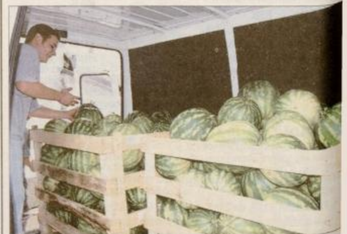
Vitomarske lubenice vsak dan sveže potujejo do kupcev v prodajalnah Petlje.