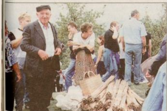
V nedeljo je bilo pri Avguštinu toliko romarjev, kot jih že dolgo ne pomnijo.