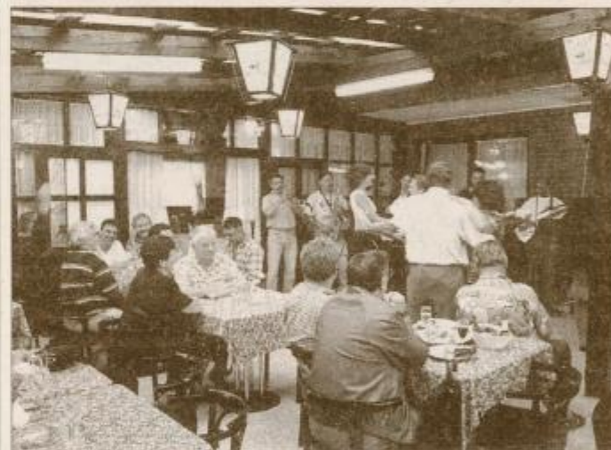
Ob odprtju gostišča so goste prijetno presenetili člani ansambla Karavans.

Eden najpopularnejših izdelkov Perutnine Ptuj je klobasa poli, ki jo podjetje po enakem receptu izdeluje že 25 let. Z njo je bila Perutnina leta 1974 ena od utemeljiteljic predelave klobas iz piščančjega mesa v Evropi. Na letošnjem sejmu je ta jubilej proslavila tako, da je vsaj dvakrat dnevno obiskovalce povabila na degustacijo štirimetrskih sejmskih polijev. Poli ima največ potrošnikov v Sloveniji, Bosni, na Hrvaškem, v Makedoniji, v zadnjem času tudi na Švedskem, pripravljajo pa se tudi na uveljavitev klobase na nemškem tržišču.