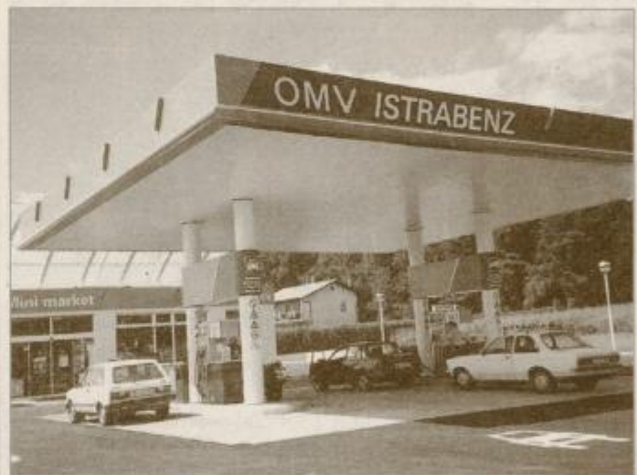
Lepo urejen bencinski servis na Zg. Polskavi.

Ob magistralni cesti Maribor - Slovenska Bistrica na Zgornji Polskavi, v sosesčini znane gostilne Golob, v solastništvu OMW Istrabenza iz Kopra ter podjetja Belič, d.o.o., z Zgornje Polskave že skoraj mesec dni obratuje nov bencinski servis.