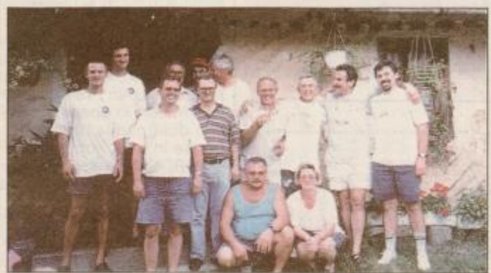
Dolgoletni privrženci modelarstva pravijo, da so na Ptuj dobri temelji za njegov razvoj