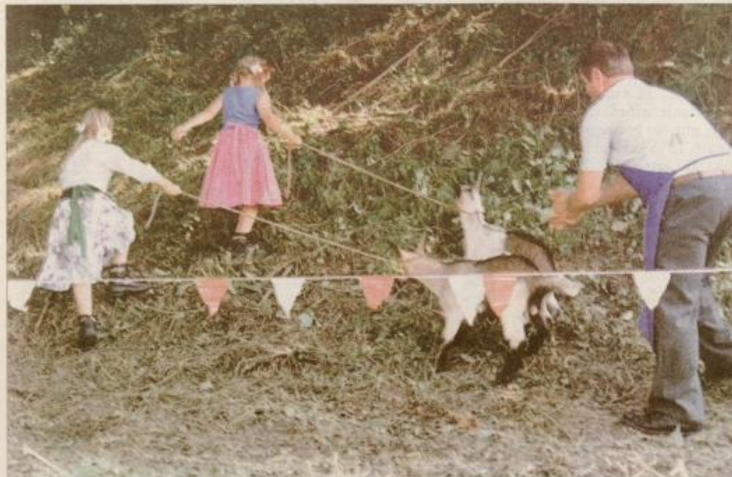
Navzgor po progi v paru - kozi pa nikamor