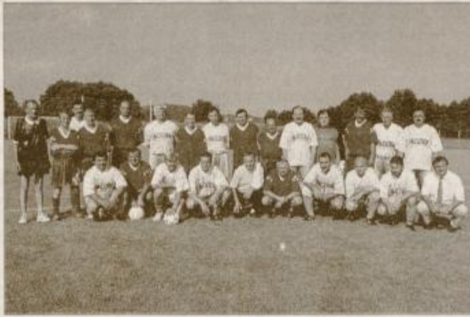
Na novem igrišču v Skorbi so se prvi pomerili veterani domačega nogometnega kluba in Hajdine.

Lepo in sončno sobotno popoldne so v Skorbi nadaljevali s prvo nogometno tekmo na novem igrišču. Pomerili so se stari rivali, veterani Skorbe in Hajdine, ki se jim je pridružil še