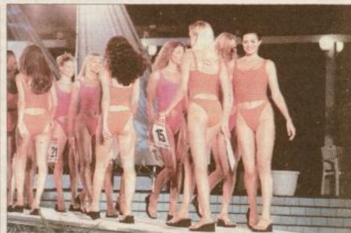
Nastop deklet v kopalnih Lisca Fashion

Adelini želimo dobro uvrstitev tudi na finalni prireditvi v Cankarjevem domu. Od včeraj pa je tako kot tisoči srednješolcev ponovno sedla v šolske klopi. Pred njo je zaključno leto šolanja v srednji šoli za oblikovanje in fotografijo v Ljubljani, ki bo od nje terjale še dodatne napore.