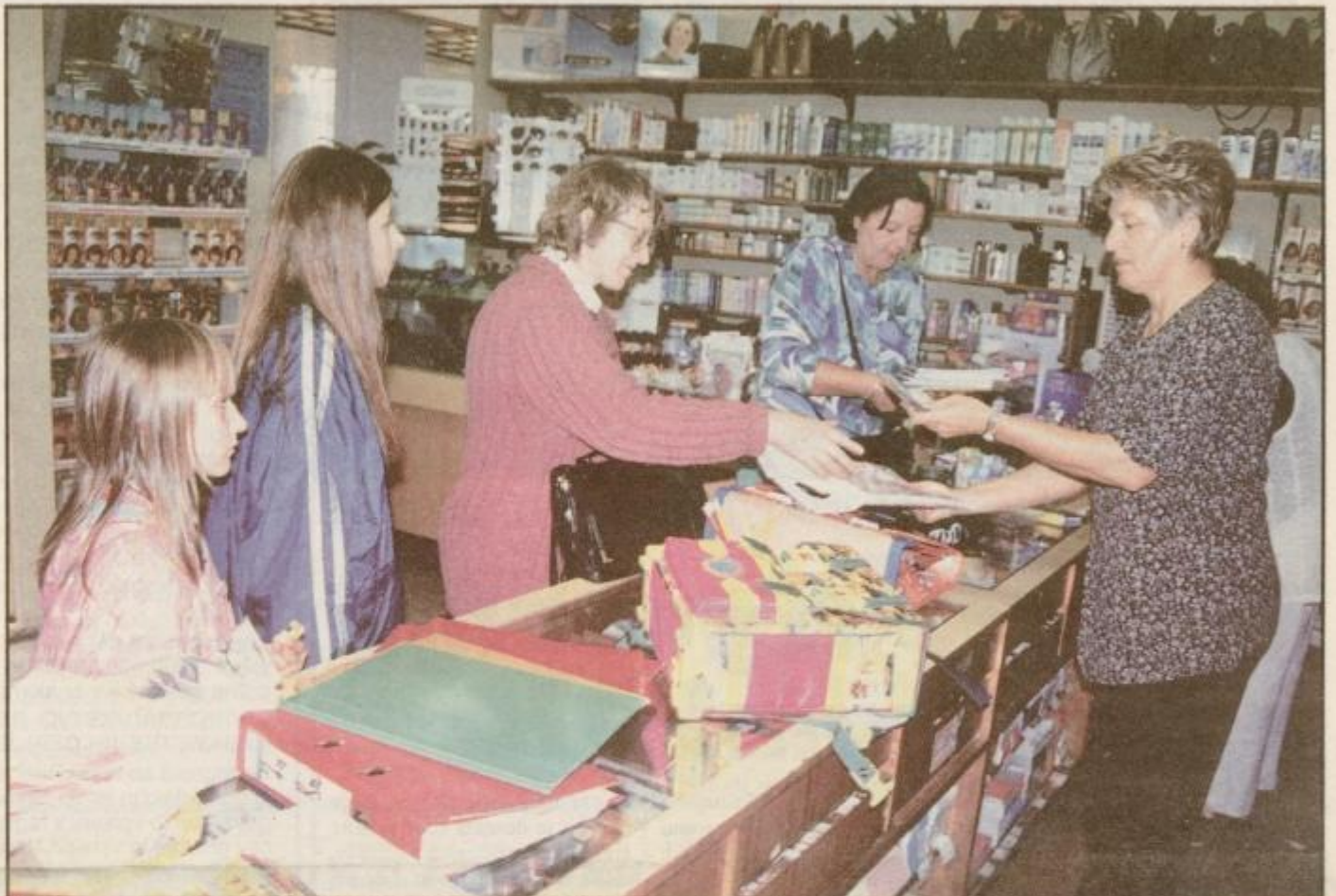
Pred začetkom šolskega leta je potrebno nakupiti to in ono ...