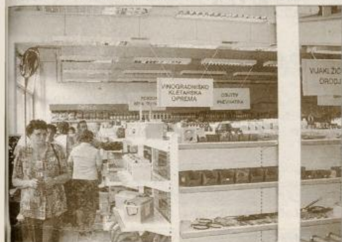
Notranjost nove samopostrežne prodajalne

ZGORNJA POLSKAVA / ODPRT NOV BENCINSKI SERVIS