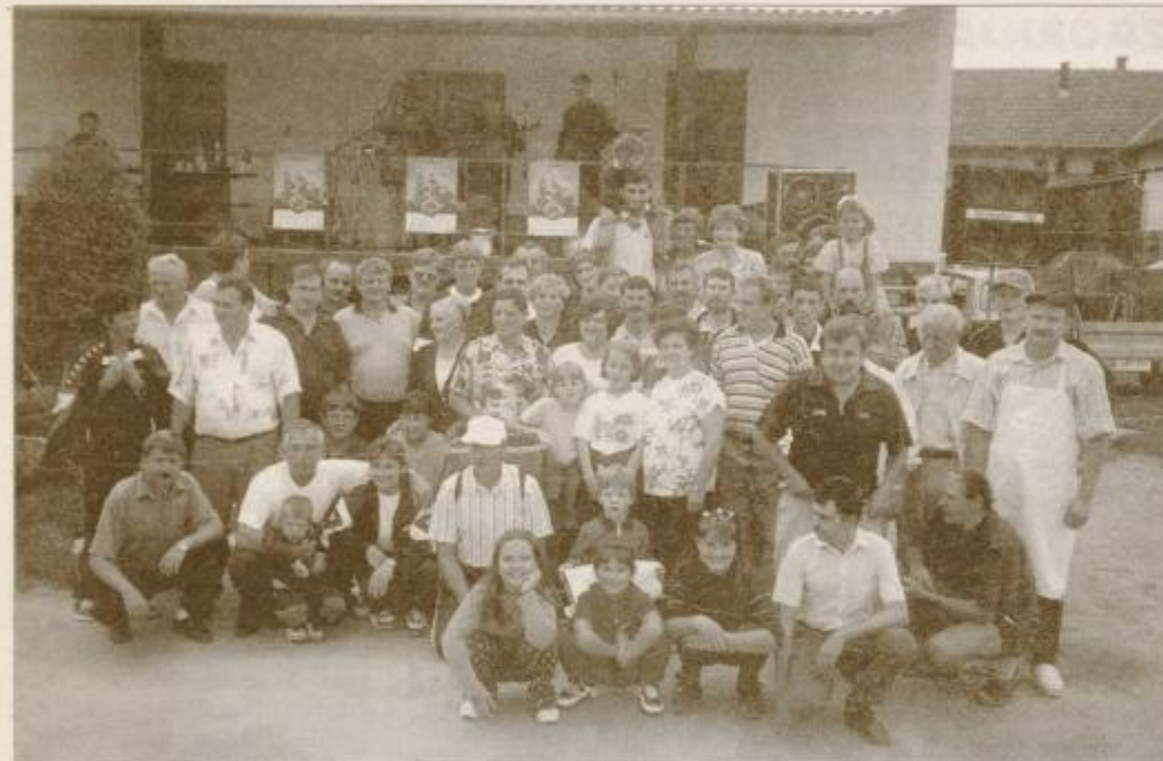
Člani etnografskega društva Korant z gosti

Člani Etnografskega društva Korant iz Markovcev so najbolj delavni in polni veselja v predpustnem in pustnem času, radi pa se povesejajo tudi čez leto, še posebej v poletnih mesecih. Na povabilo svojih prijateljev iz Kostanjevice na Krki, ki prav tako ohranjajo stare pustne običaje, so se tudi letos odpravili na Kostanjeviško noč, kjer so uživali ob čudovitem ognjemetu in okusnem cvičku. V zahvalo so jih v soboto, 21. avgusta, povabili na Štajersko, med povabljenimi pa sta bili tudi primorski skupini iz Liga in Drežniških Ravn. Slednji so znani po maskaradah "pustih" in bodo naslednje leto prvič sodelovali na markovskem fašenku.