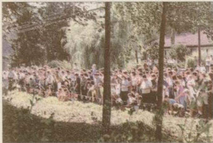
V Podgorcih je bilo v nedeljo več kot 500 obiskovalcev