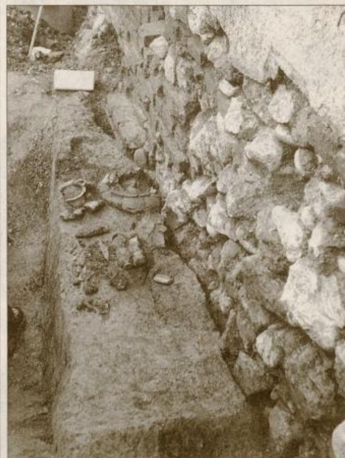
Ostaline 2700 let starega žganega groba v Ulici Viktorina Ptuj-skega.