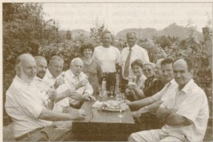
Kovali so načrte za turistični razvoj v občini Videm

SLOV. BISTRICA / 40 LET Ljudske univerze