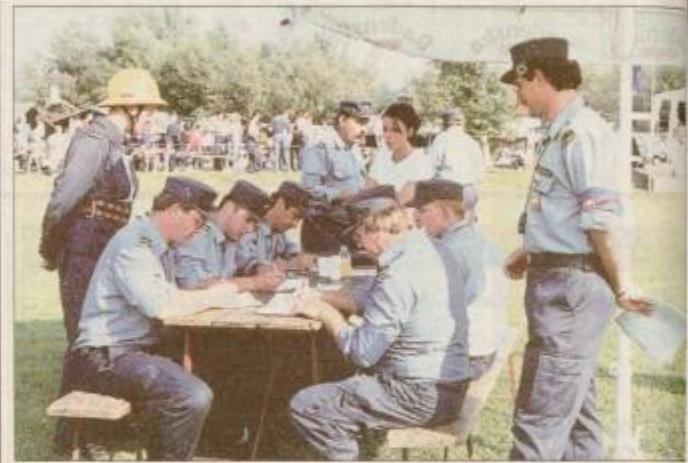
Sodniki hajdoškega tekmovanja.