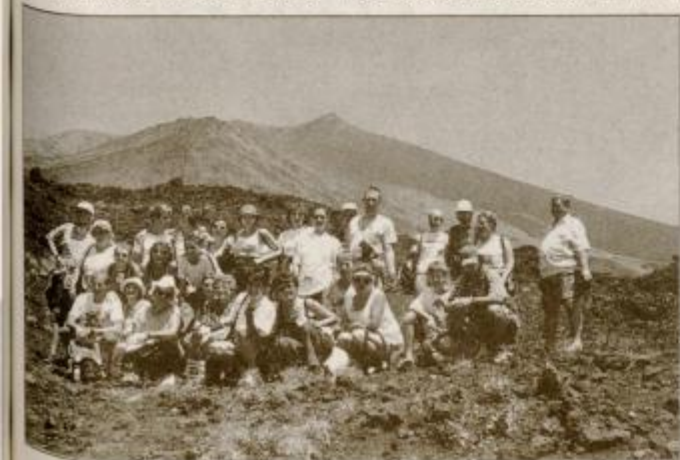
Cirkovčani na Etni.