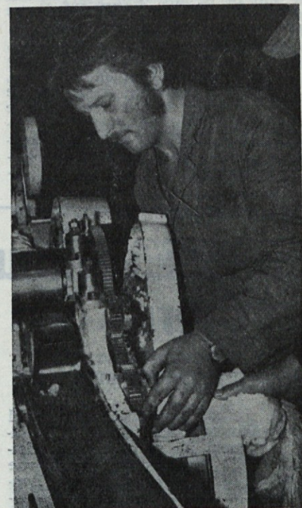
Star stroj — pogosta popravila

rili za potrebe TOZD in delovne organizacije. Objektivna sodba o doseženih rezultatih bi bila, da so re-