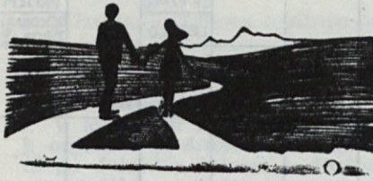
Pohorič Duša — GROSELJ