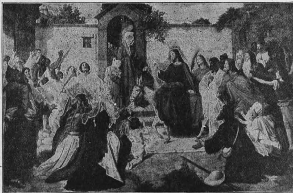
Jezus jezdi v Jeruzalem.

Čemu sploh hoditi v cerkev? Sv. evangelij pravi: “Dva človeka sta šla v tempelj molit”. To je toraj en namen: Molitev. Bog sam si je odločil poseben kraj, kjer hoče biti češčen. “Pisano je: Moja hiša je hiša molitve”. Čemu hoditi v cerkev? Kristus Gospod je rekel: “Ne samo od kruha živi človek, marveč od vsake besede, ki prihaja iz ust Božjih”. Božje besede nam je treba, to je kruh za našo dušo. Zato pa radi poslušajmo božjo besedo, ne