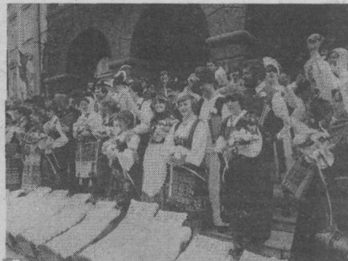
Predpočitniška prireditev v Ljubljani: Kmečka ohcet '81