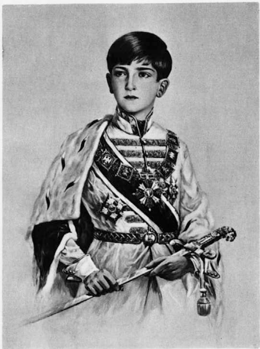
Nj. Vel. kralj Peter II.