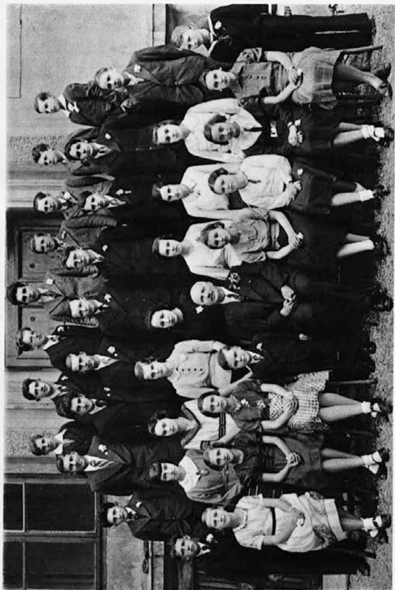
Najboljša mladina na drž. realni gimnaziji kralja Aleksandra I. Zedinitelja v Kranju