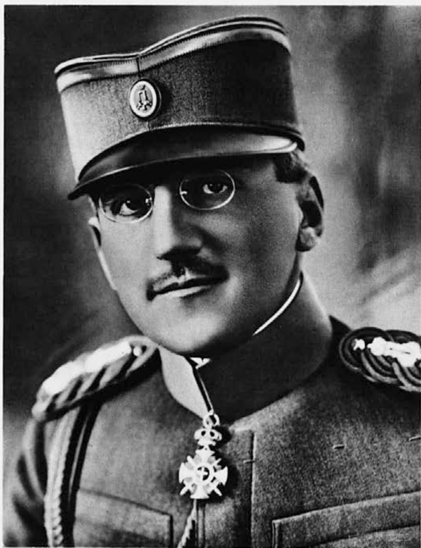
Blagopokojni kralj Aleksander I. Zedinitelj