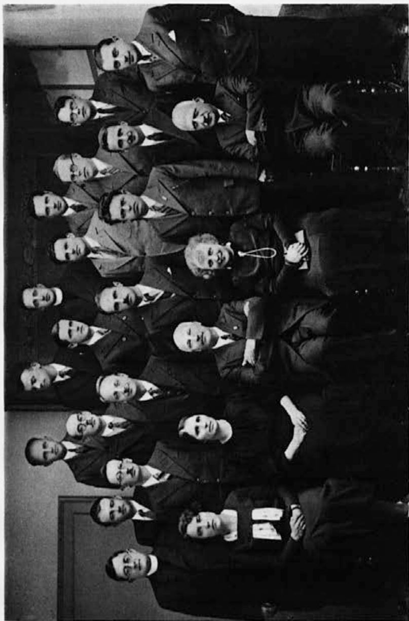
Profesorski zbor drž. realne gimnazije kralja Aleksandra I. Zedinitelja v Kranju